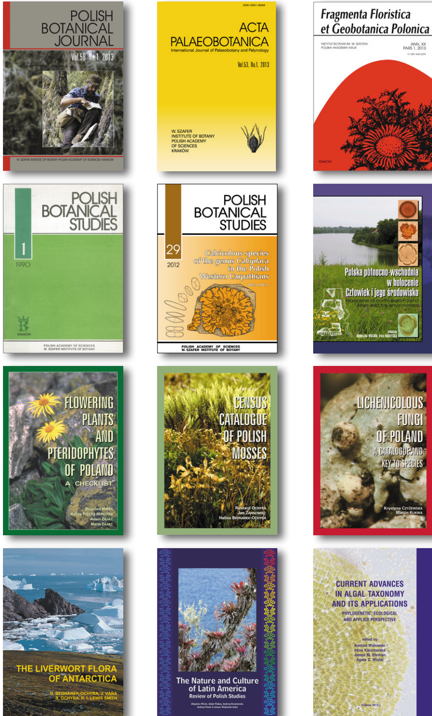
Ryc. 4. Czasopisma, wybrane serie wydawnicze i książki wydane w Dziale Wydawnictw IB PAN.