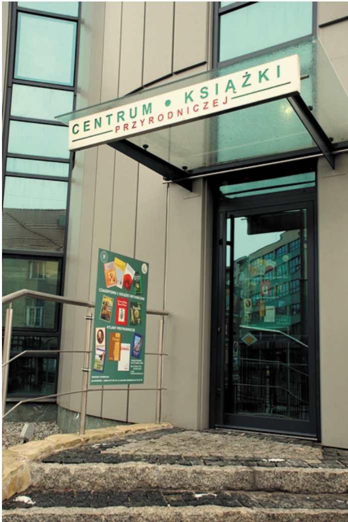
Ryc. 3. Wejście od strony ul. Lubicz do Centrum Książki Przyrodniczej.