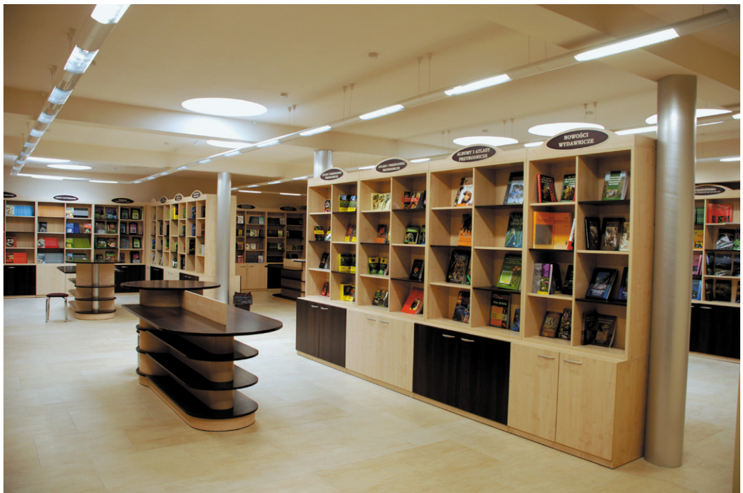
Ryc. 2. Sala Księgarni w Centrum Książki Przyrodniczej.

Obecnie priorytetowym zadaniem w ramach działalności wydawniczej Instytutu jest stworzenie nowoczesnej platformy wydawniczej „IB Publisher” obsługującej obróbkę redakcyjną, przygotowanie do druku i publikację elektroniczną artykułów do wszystkich trzech czasopism.