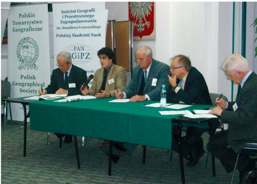
Fot. 2. Uczestnicy panelu dyskusyjnego “Networking in the European, regional and local space” podczas Warsaw Regional Forum 2009