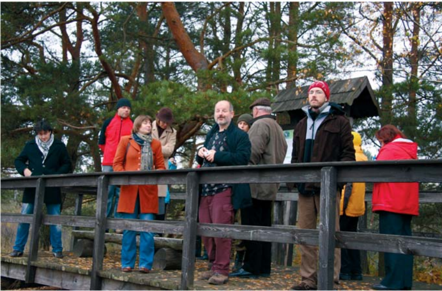
Fot. 1. Uczestnicy studiów terenowych Warsaw Regional Forum 2009 w Biebrzańskim Parku Narodowym