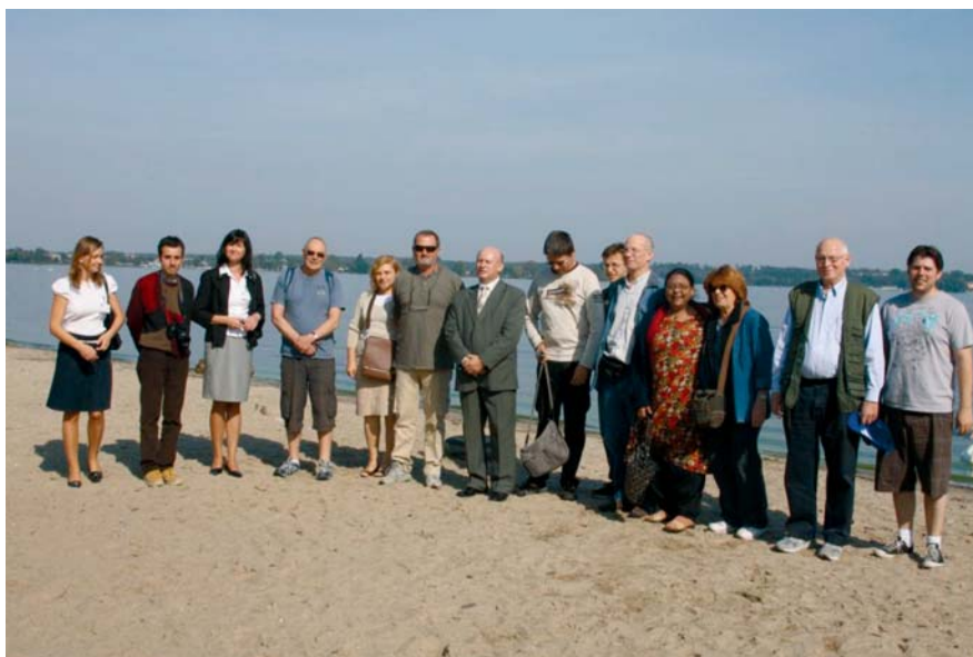
Fot. 1. Uczestnicy konferencji w trakcie spotkania z przedstawicielami władz lokalnych w Nieporęcie

Pomimo pewnego eklektyzmu tematycznego wygłoszonych referatów, zauważalna jest również ich spójność – wszystkie nawiązywały do wewnątrzregionalnych różnic obszarów położonych w różnych częściach świata. W trakcie licznych dyskusji (pół godziny po każdym dwóch referatach) wskazywano na istniejące podobieństwa bądź rozbieżności prowadzonej polityki rozwoju oraz funkcjonowaniu samorządu terytorialnego. Ponadto fakt, że uczestnicy spotkania reprezentowali różne dyscypliny naukowe (geografia, ekonomia, planowanie przestrzenne, gospodarka przestrzenna) sprawił, iż prowadzona dyskusja była bardzo ożywiona, a szeroka reprezentacja narodowościowa umożliwiała prowadzenie kompleksowych porównań aspektów związanych z rozwojem lokalnym w różnych systemach gospodarczych, społecznych i kulturowych.