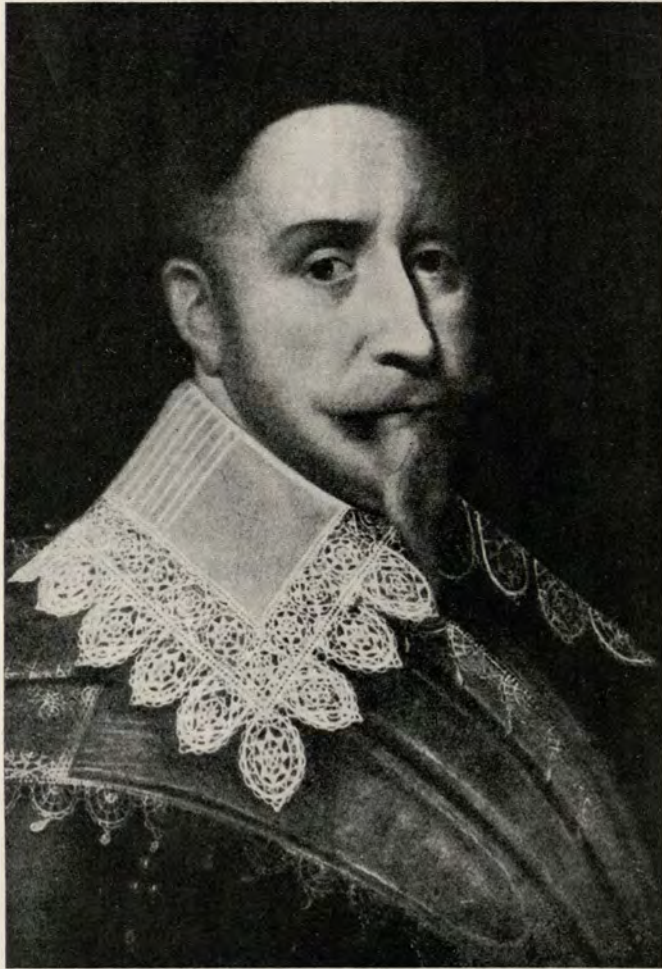
GUSTAV II ADOLF