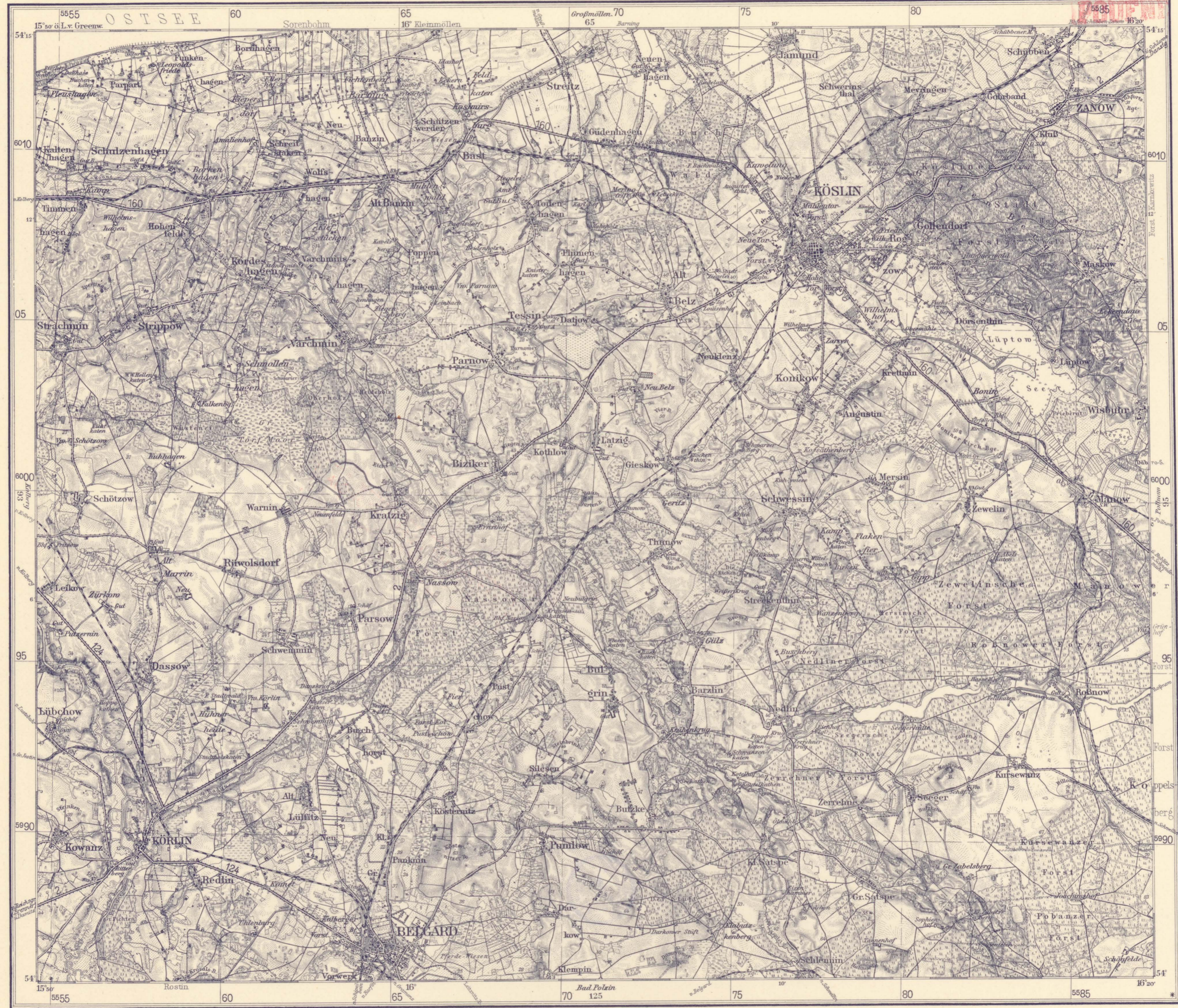
Karte des Deutschen Reiches 1:100000 (1cm-Karte)

Główny Urząd Geodezji i Kartografii BELEGATURA w KOSZALINIE ul. Alifreda Lampa 34 94 Koslin