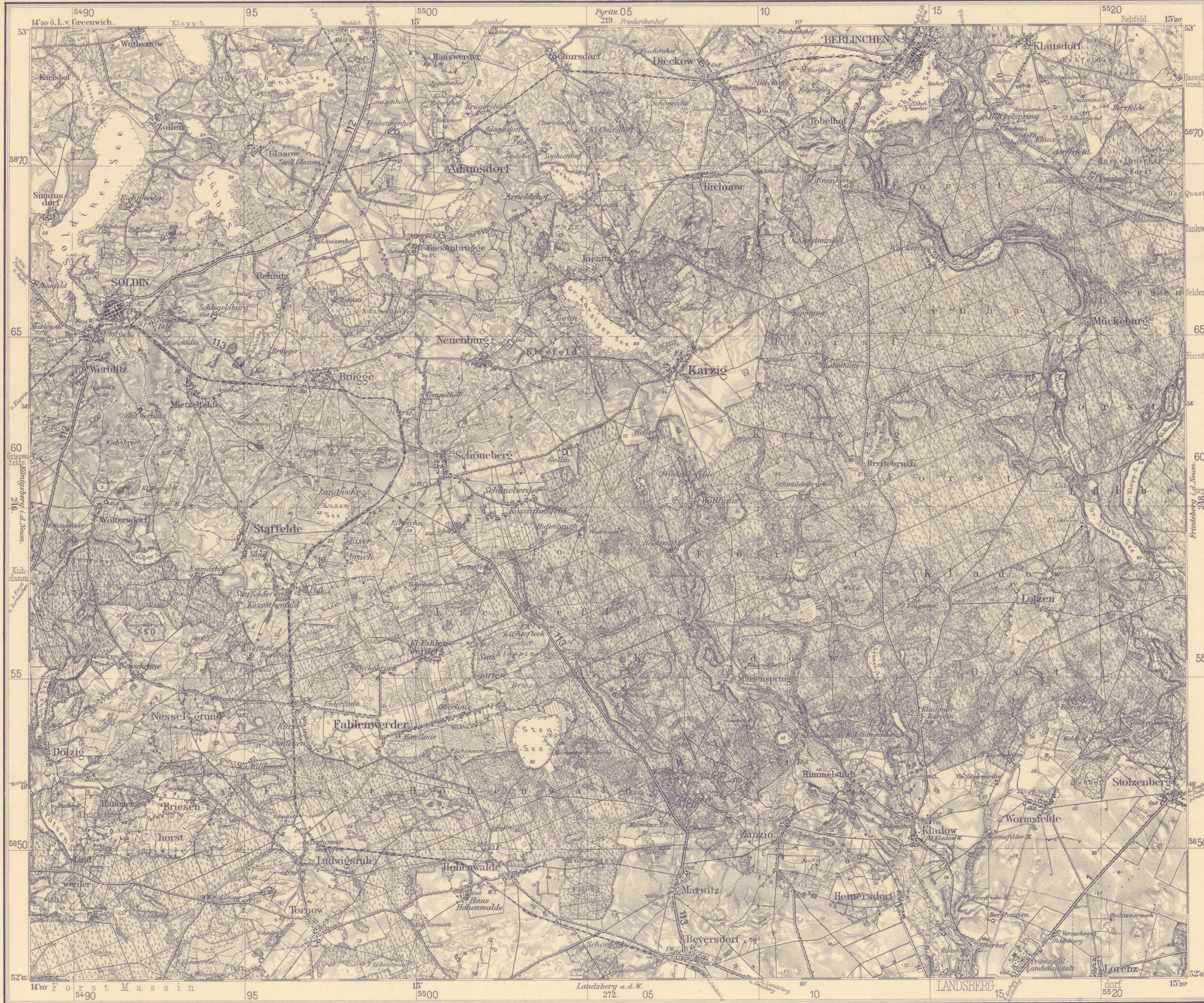
Karte des Deutschen Reiches (1cm-Karte).