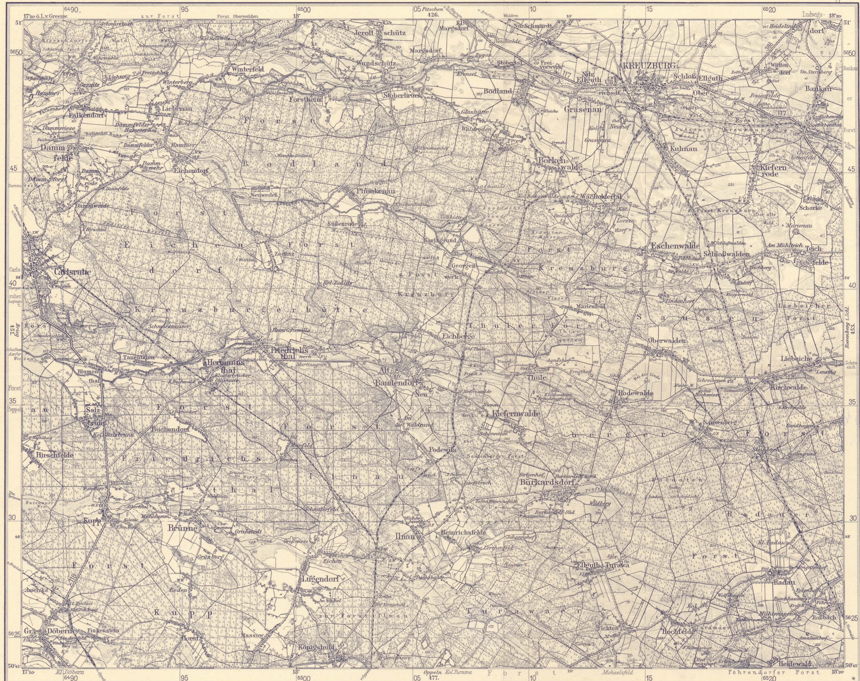
452. Kreuzburg i.Schl.