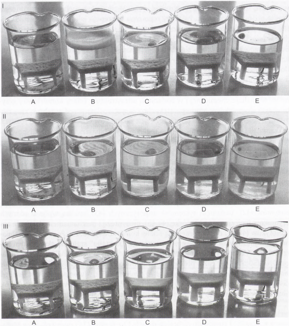
Rys. 2. Enzymatyczne usuwanie biofilmu związanego z płytką akrylową (26). Widok przed (I), po 12-godzinnej hydrolizie (II) i kilkakrotnym płukaniu wodą (III). (A – kontrola bez dodania enzymu, B – preparat handlowy, C – egzomutanaza + dekstranaza, D – endomutanaza + dekstranaza, E – egzomutanaza + endomutanaza + dekstranaza).