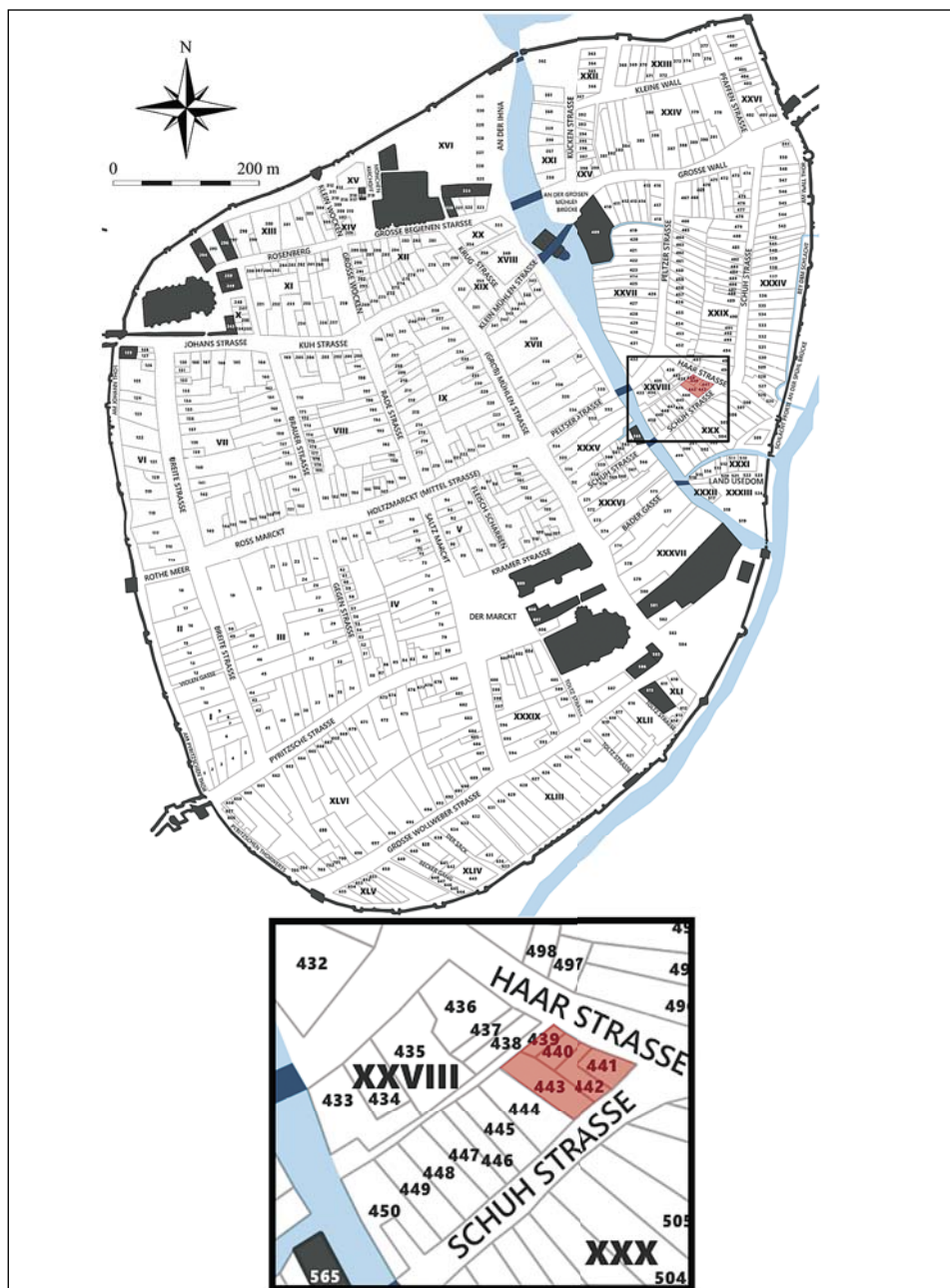
Ryc. 1. Stargard, Stare Miasto. Plan miasta według M.F. Schwedtkena z 1724 r. z zaznaczonym terenem badań w części tzw. kwartału XXVIII. Oprac. I. Wojciechowska, rys. M. Szeremeta