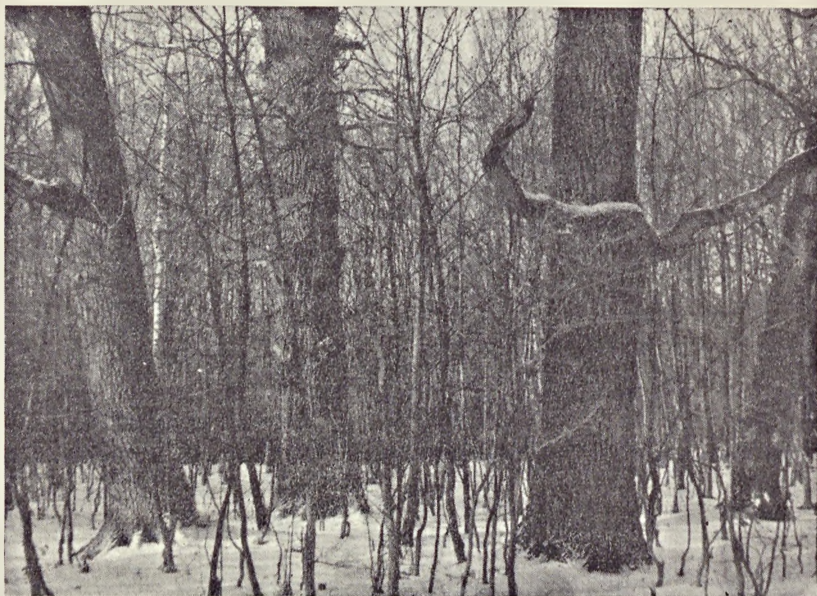
Ryc. 2. Grupa dębów szypułkowych Quercus robur w oddziale 20 (n-ry: 185, 186 i 187). Obwód: 339, 295 i 347 cm