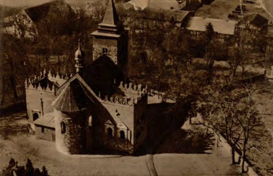
Kościelec k. Inowrocławia: Kościół