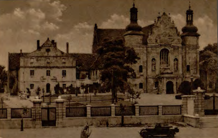
Strzelno: Kościół-klasztór ponorbertański, ob. parafialny