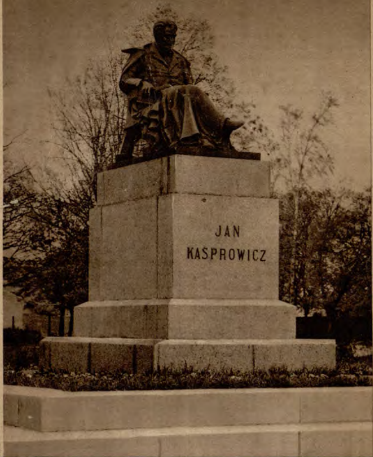
Inowrocław: Pomnik Jana Kasprowicza