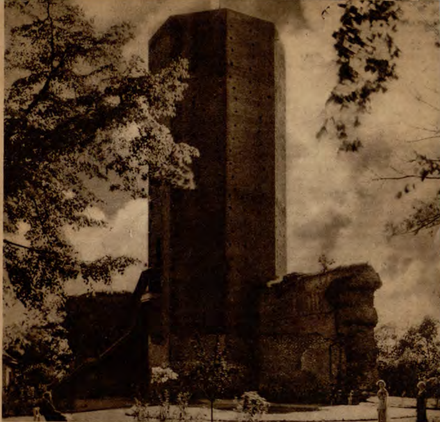
Kruszwica: Mysia Wieża