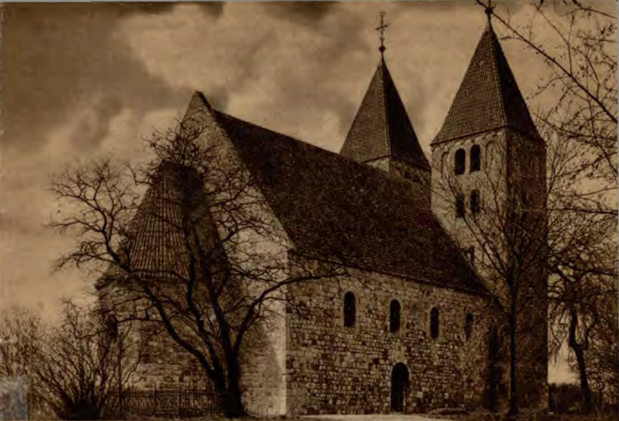
Inowrocław: Kościół P. Marii