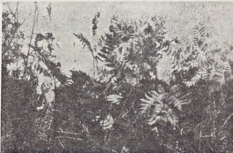
Ryc. 1. Stanowisko długosza królewskiego Osmunda regalis w borze bagiennym koło Podlubienia. — The locality of the fern Osmunda regalis in the swampy coniferous forest near Podlubień.

Przybrzeżne strefy stawu pokrywa pływające pło zbudowane głównie z dwóch gatunków torfowców. Są to Sphagnum nemoreum i Sphagnum cuspidatum . Ten nawodny mszar jest miejscem vegetacji rosciczki okrągłolistnej Drosera rotundifolia . Wzdłuż brzegów zbiornika ciągną się