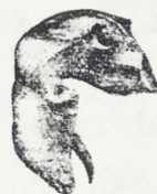
Fig. 4. Eiusdem stemmatis scapus a parte inferiore antica visus.

gines postici oculorum posticorum lateralium vix pone puncta media mediorum siti; oculi medii postici paullo oblongi, paullulo angulati, ca. 0·175 longi, 0·145 lati, laterales 0·195 longi, 0·15 lati, anticorum diameter 0·21 longa. Mandibulae 1·6 longæ, 1·3 latæ, dorso basi leviter convexo, ceterum in longitudinem levissime concavo. Sternum modo ut in femina sculptum, modo insuper carinulis humillimis, varium in modum curvatis et fractis ornatum, maculæ nitidæ tum indistinctæ. Palporum pars femoralis 1·7 longa (linea recta dimensa), insigniter deorsum curvata, in parte apicali ca. \frac{1}{3} leviter angustata et modice attenuata: pars patellaris 0·9 longa, lateribus parallelis, tibialis 1·0 longa, modice deorsum curvata, basi ca. \frac{1}{3} angustior, prope apicem vero æque fere lata atque patellaris, a latere visa crassitudine ubique fere æquali; pars tarsalis 0·95 longa. Stemmatis (fig. 2, 3, 4) bulbosus a latere visus ca. 0·9 longus, 0·5 latus, latere antico leviter, postico insigniter et apicem versus fortius convexo, a fronte visus ca. 0·55 latus, lateribus: exteriori infra, interiori vero supra fortiter convexis, ceterum rectis fere et inter se parallelis; scapus magnus valde et inæqualis, basi