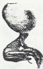
Fig. 3. Idem a fronte simulque paullo desuper visum.