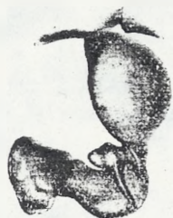
Fig. 2. Harpactes Chyzeri , stemma palpi sinistri a latere exteriori visum.

Mas. Cephalothorax 3·8 mm longus, 2·9 latus, parte cephalica anteriora versus insigniter angustata, ante ca. 1·5 lata, lateribus supra basim palporum paullulo modo sinuatis; pars cephalica in laterum parte anteriore granulis minutis dispersis piligeris ornata (vestigia granulorum talium etiam in femina cernuntur); dorsum magis inæquabiliter quam in femina. pone oculos fortius, convexum; pars thoracica maculis opacis caret, ut in ♀ reticulata et insuper punctis impressis vadosis, quasi erosis, adpersa; impressiones cephalicæ vadosæ. Mar-