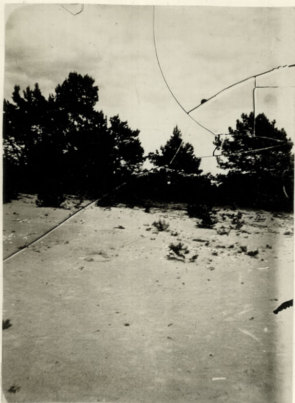
Wydma Łubien - ementaryko.

Najobfitszym materiałem, jaki się spotyka na ementaryku, są kości ludzkie, których bardzo gromady i utamki zalegają cały teren. Kości te porządnie pochowane, ale w końcu w jedno miejsce, zakopali napowrót chłopcy ze wsi Łubien; obecnie można wiatr je wydmuchać, a nawet dżonki wymywać. Kości są zniszczone zupełnie, są wyjątkiem ud i pinoceli, które zachowały się jakos tak; czasami jednej nie się spotkać nieuszkodzonej.