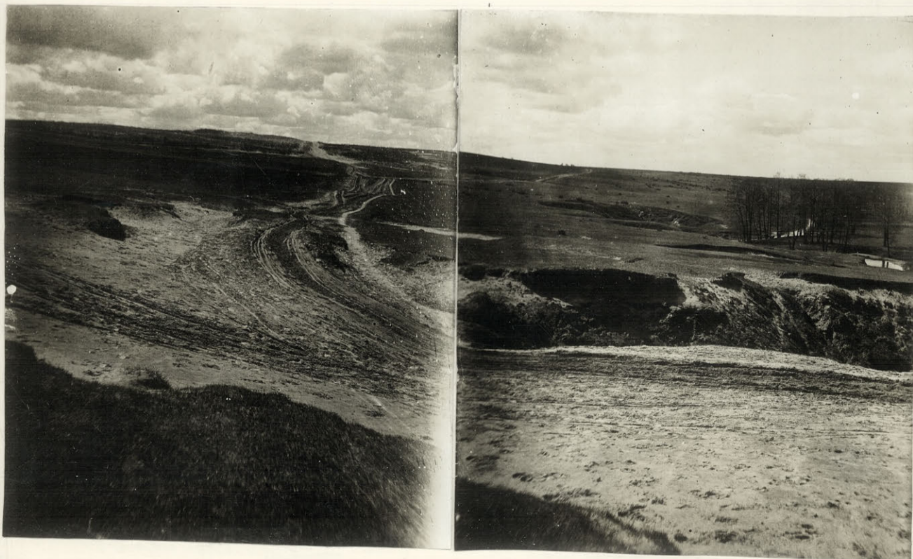
widok na wydmy Łubienki

Wydma jest bardzo rozległa (4 km. \square w przybliżeniu), leży na lewym brzegu n. Łubienki, niedaleko dojeżdżenia Kojdanowskiego, za cementarnią katolicką (starym).