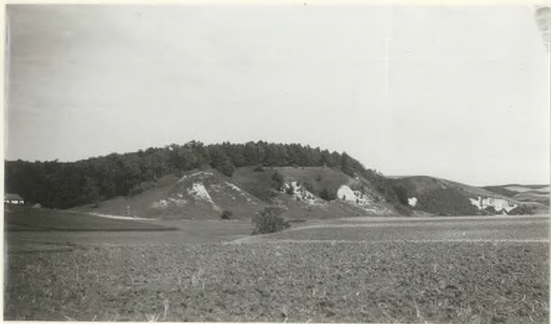
W. Horadok (Grudok), pow. Równe. Padzieta pastja (i poczeka, wskutek erozji wtekucej) wysokiego prawego brzegu doliny Ucia, t. zw. „Wismiona Hora” (na piernym placie, na rozci i zbocach pokryta lasem). Zbocze od strony doliny pokrywa reliktowa roślinność stepowa. VIII. 1935.