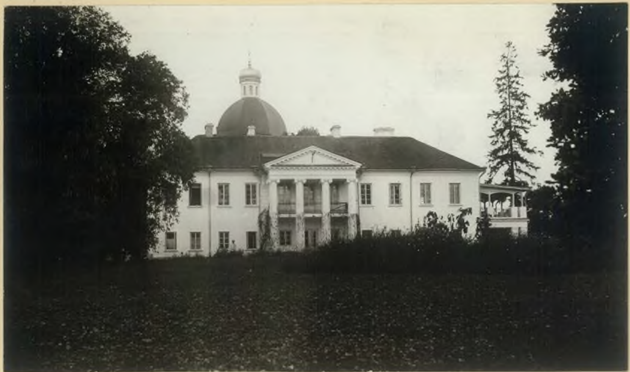
Hradec královský. Palác na nábřeží v porobu z XVIII. st. Pa. patálem křepala celhan (dau. kóicót)