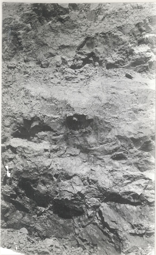
41. Wielka Kuszarka, gm. Skierbieszów, pow. Zamówie Profil I; zdjęcie neregularne.