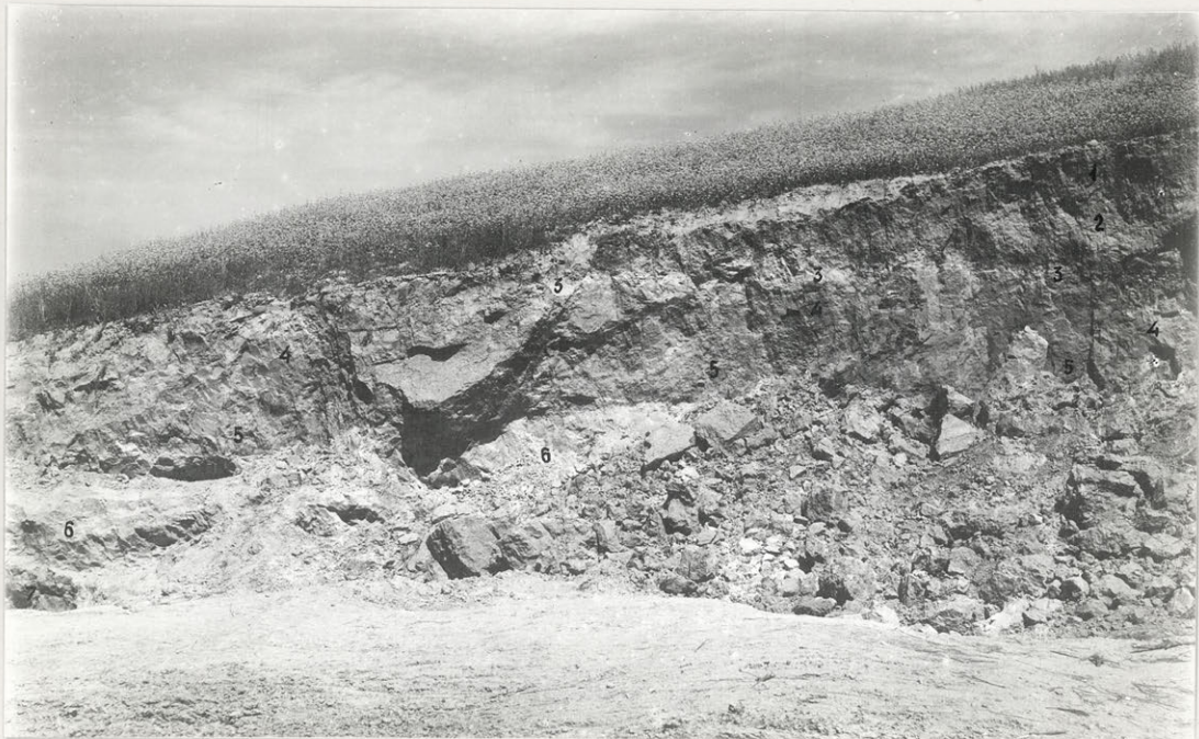
Fig.4. Część zachodnia profilu w Huszczce Wielkiej. 1 - gleba współczesna i zmywy zboczowe; 2 - less subaeralny; 3 - gleba kopalna biellicowa; 4 - less zboczowy/granica dolna, wskutek jednakowego zabarwienia leży utworu i podścielającej go moreny, niewidoczna; 5 - morena górna; 6 - piaski międzymorenowe; 7 - morena dolna.