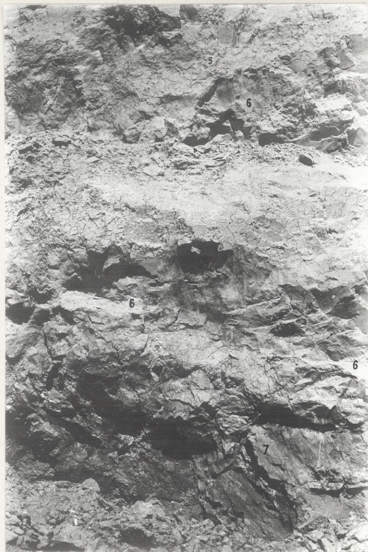
Fig.5. Odsłonięcie na krańcu zachodnim profilu w Huszczce Wielkiej. 5 - morena górna; 6 - piaski międzymorenowe; 7 - morena dolna.