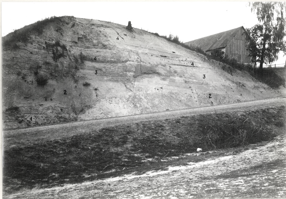
Fig.6. Dworzyska, zachodnia ściana wykopu. 1 - aluwja piaszczyste, 2 - typowy less subaeralny młodszy górny; 3 - utwór zastoiskowy lessowy; 4 - serja piaszczystych aluwjów rzecznych; w stropie warstwa gleby współczesnej leśnej.