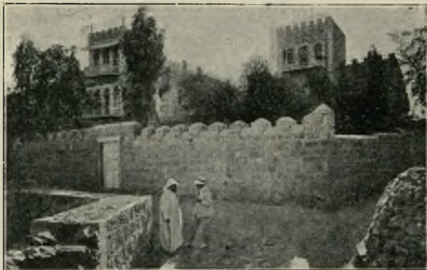
WIDOK OGÓLNY SZKOŁY.

SKIEJ, SIĘGAJĄCEJ KORZENIAMI W PRZESZŁOŚĆ, CZERPIĄCEJ SOKI WE WSPÓŁCZESNYM BYCIE, POD WPLYWEM EGZOTYCZNEJ SZTUKI WSCHODU I SUBTELNEJ KULTURY EUROPY. W TEN SPOSÓB „B” ZJEDNOCZYŁ W SOBIE DZIAŁALNOŚĆ JAKA W INNYCH WARUNKACH JEST SPEŁNIANĄ PRZEZ CAŁY SZEREG ODDZIELNYCH INSTYTUCJI, I TYM WAŻNIEJSZĄ NATURALNIE JEST PLACÓWKA, JAKĄ ZAJĄŁ NA GRUNCIE PALESTYNY.