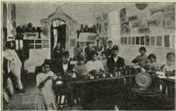
PRACOWNIA WYROBÓW METALOWYCH,

STOSOWANEJ; PRACOWNIA WZORÓW W RÓWNEJ MIERZE ZA- SILA RÓWNIEŻ I INNE DZIAŁY: W PIERWSZEJ LINII INTENSYW- NIE SIĘ ROZWIJAJĄCY W LATACH OSTATNICH DZIAŁ FILIGRA- NOWY (GŁÓWNIEMIE LEKKIE WYROBY SREBRNE—PRZEDMIOTY OBRZĘDÓW RYTUALNYCH, PAMIĄTKOWE I T. D.), KTÓRY POD WZGLĘDEM ZBYTU ZNACZNIE WYPRZEDZIŁ INNE ODDZIAŁY SZKOŁY; OBOK FILIGRANÓW POMYŚLNIE ROZWIJA SIĘ PO- KREWNY METALOWY PRZEMYSŁ, WYRÓB PRZEDMIOTÓW MIEDZIANYCHCYZELOWANYCH, TRAJBOWANYCH I TRAWIONYCH (DAMASCENSKA ROBOTA). Z TECHNIK DRZEWNYCH NAJBAR- DZIEJ SIĘ ROZWIŃNAŁ WYRÓB RAM INKRUSTOWANYCH ZWYKŁĄ INTARSJĄ I MASĄ PERŁOWĄ; W ROKU 1900 WRESZCIE POW- STAŁ ODDZIAŁ KORONKARSKI, ZNACZNE ROKUJĄCY NADZIEJE.