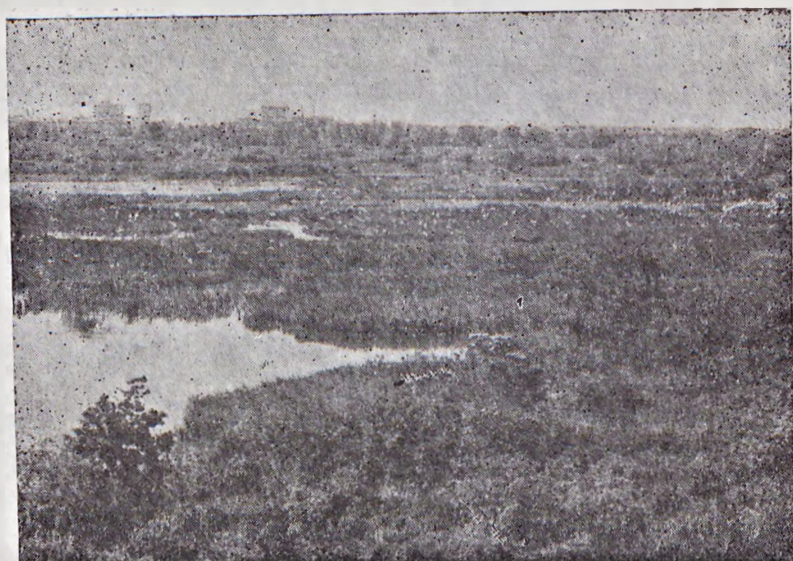
Ryc. 3. Rozlewiska i bagienne wyspy — raj ptasi „Międzyodrza” — ciągną się kilometrami aż po Szczecin. — Overflows and marshy islands — the paradise of the “Interodrza” region, stretch many kilometers long as far as the town of Szczecin.

poscierający się między korytem Odry, przy wschodniej krawędzi doliny, i kanałem żeglownym „Hohensaaten-Friedrichsthaler Wasserstrasse” przy krawędzi zachodniej. Płaskie dno doliny na całej przestrzeni pocięte jest łachami, starorzeczami i rozlewiskami połączonymi w sieć kanałów i rowów. Na polskim Międzyodrzu otwarte wody stanowią ponad 10% powierzchni, a długość kanałów wynosi ok. 200 km.