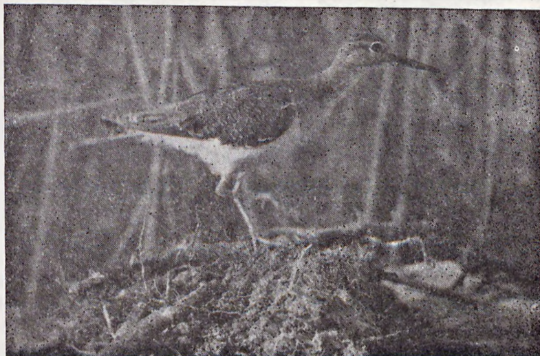
Ryc. 4. Łęczak, inaczej brodziec leśny, gatunek chroniony, należy do stosunkowo licznych ptaków przelotnych Nadodrza. — The wading bird Tringa glareola , a species protected by law, belongs to the fairly numerous migratory birds of the Odra region.

sywniejszej gospodarki. Na terenie Międzyodrza zarzucono działania gospodarcze, pozostawiając ten obszar we władaniu przyrody. Badania szaty roślinnej wskazały już w latach pięćdziesiątych na jej naturalny charakter, jako roślinności szuwarowej i błotnej (J a s n o w s k i 1962). Trudno dostępne, niewydajne rolniczo tereny Międzyodrza od lat zakwalifikowane są jako nieużytki. To właśnie zdecydowało, że dominują tu naturalne biocenozy, z całym ich bogactwem przyrodniczym.