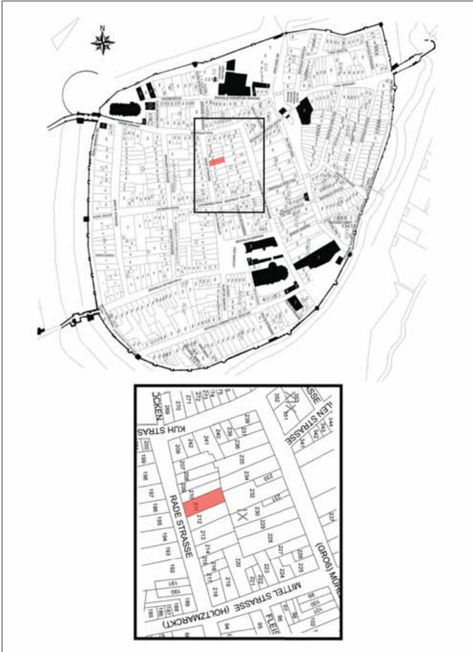
Ryc. 1. Stargard, Stare Miasto. Plan miasta według M.F. Schwedtkena z roku 1724 z zaznaczoną działką miejską, na której odkryto figurkę Chrystusa. Oprac. I. Wojciechowska, rys. C. Rysz

Fig. 1. Stargard, the Old Town. A street plan after M. F. Schwedtken, 1724, with an indication of the plot on which the figurine of Christ was found. Compiled by I. Wojciechowska, drawn by C. Rysz