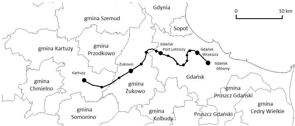
Ryc. 2. Przebieg linii Pomorskiej Kolei Metropolitalnej na odcinku Gdańsk Główny-Kartuzy Route of the Pomeranian Metropolitan Railway line on the section Gdańsk Główny-Kartuzy

i dobrze skomunikowana z Gdańskiem, liczba mieszkań oddanych do użytkowania wzrosła z ok. 160 w 2012 r. i ok. 200 w 2013 r. do ok. 300 w 2016 r. i ok. 380 w 2017 r. Nowe mieszkania oddawano do użytkowania głównie we wsi Kowale przy obwodnicy trójmiejskiej.