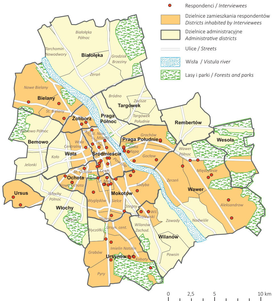
Ryc. 1. Miejsca zamieszkania respondentów

Opracowanie własne na podstawie wywiadów zrealizowanych w 2011 r.