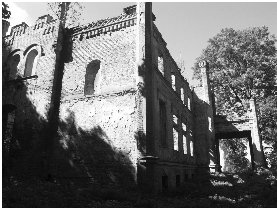
Fot. 3. Pałac w Sokolińcu, 2005 Palace in Sokoliniec, 2005