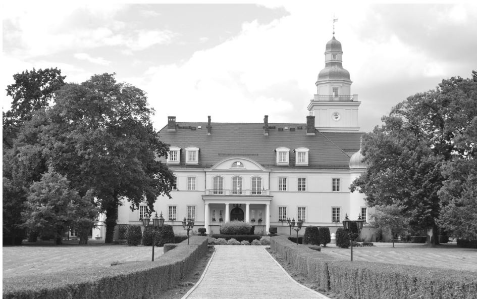
Fot. 1. Pałac w Koszewie, 2016 Palace in Koszewo, 2016