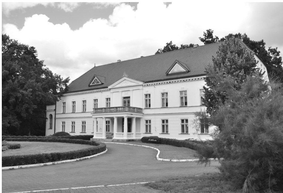
Fot. 5. Pałac w Małkocinie, 2016 Palace in Małkocin, 2016

W grupie wsi o niskim stopniu dewastacji krajobrazu znalazło się zaledwie siedem wsi. Założenia folwarczne tam występujące są obecnie użytkowane i poddawane bieżącym remontom oraz konserwacji. Zachowały się one w dobrym lub bardzo dobrym stanie (przykładem jest wieś Małkocin, w której użytkownikiem pałacu jest Uniwersytet Szczeciński – fot. 5).