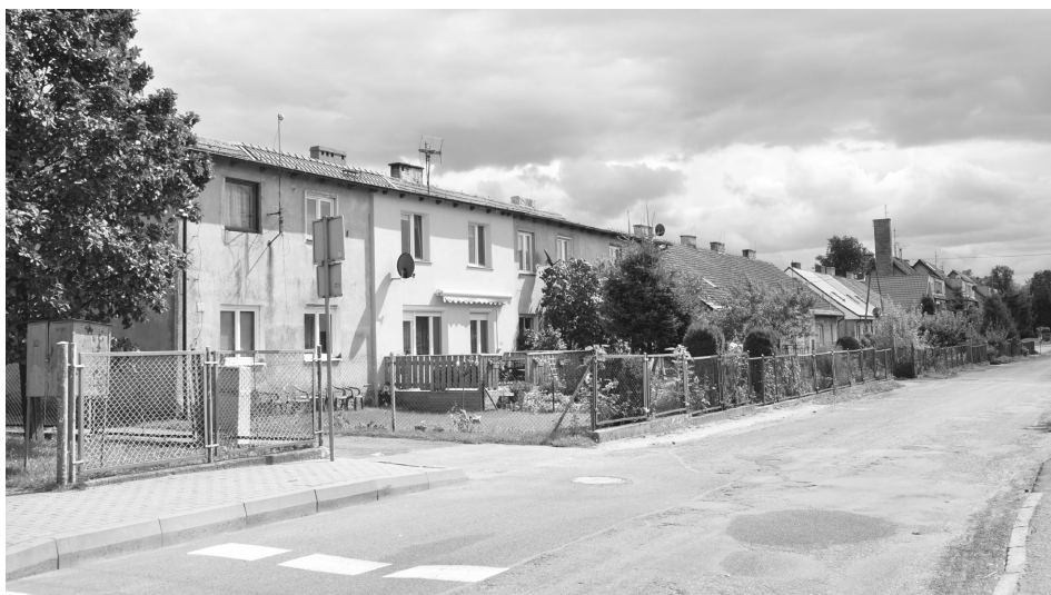
Fot. 2. Wieś Koszewo, 2016 Koszewo village, 2016

Kolejną grupę stanowią wsie o wysokim stopniu dewastacji krajobrazu kulturowego. Zakwalifikowano do niej 15 wsi, których historyczny układ przestrzenny uległ znacznym przekształceniom, z uwagi na usytuowanie w jego obrębie zespołów zabudowy mieszkalnej oraz gospodarczej. Założenia folwarczne charakteryzują się złym stanem zachowania, uniemożliwiającym w wielu przypadkach ich rewitalizację, jak w przypadku Sokolińca (fot. 3, 4).