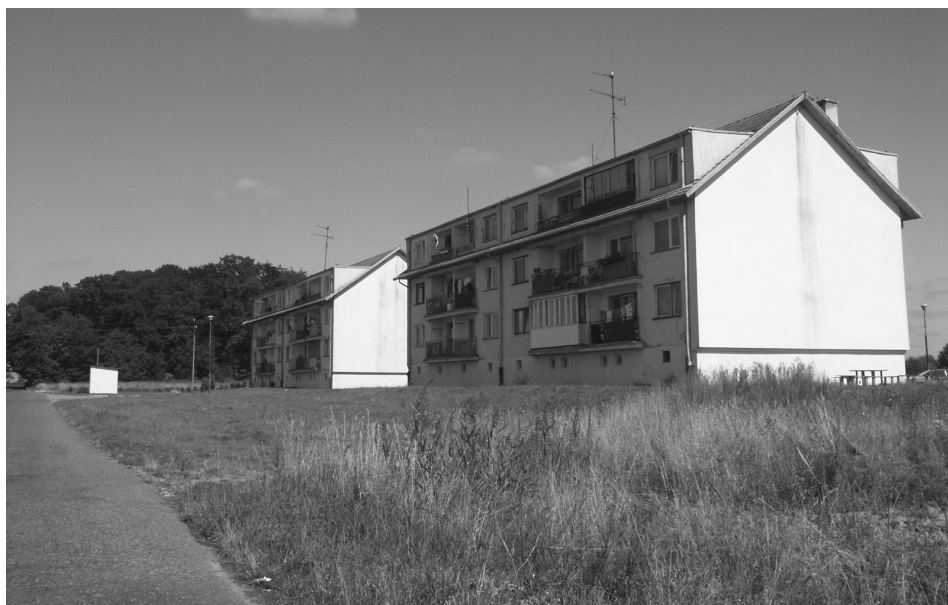
Fot. 4. Wjazd do wsi Sokoliniec, 2005 Entry to Sokoliniec village, 2005