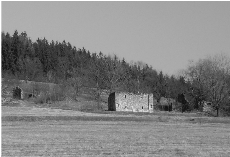
Fot. 1. Ruiny gospodarstw w górnych partiach stoków we wsi Potoczek

Ruins of farmsteads in the upper parts of slopes in Potoczek village