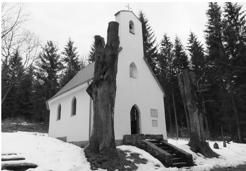
Fot. 5. Odnowiony kościółek w zanikłej wsi Karpno ponownie pełni funkcje religijno-społeczne Renovated church in a depopulated village of Karpno again fulfills its religious and social function