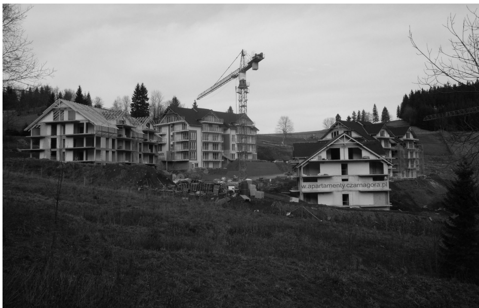
Fot. 4. Zmiana struktury funkcjonalno-przestrzennej wyludnionej wsi. Apartamentowce w Siennej w trakcie budowy Changes in the spatial and functional structure of a depopulated village. Apartments under construction in the village of Sienna