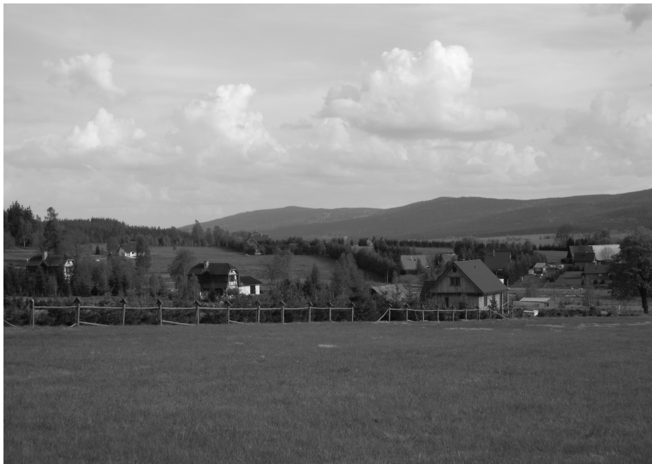
Fot. 2. Nowa rozproszona zabudowa na terenie Lasówki w większości nie odtwarza pierwotnego układu wsi Scattered pattern of new houses in Lasówka mostly did not follow the former structure of built-up areas in the village