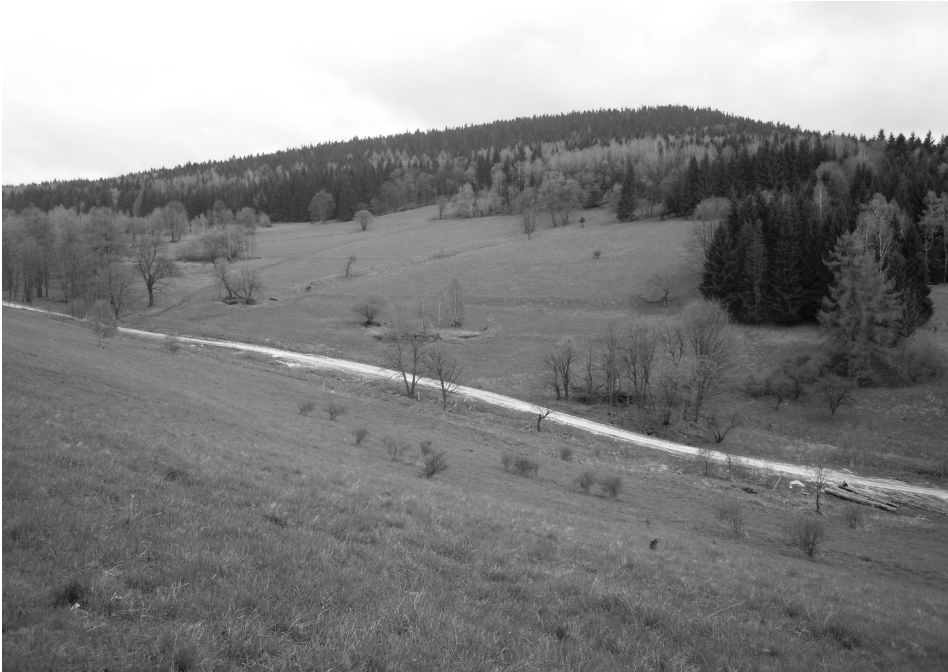
Fot. 3. Obszar sprzedanej w 2016 r. wsi Rogózka. Skupiska drzew wyznaczają miejsca ruin dawnej zabudowy The area of recently sold Rogózka village. Clusters of trees indicate places of former buildings' ruins

Procesem, który trudno jest ująć ilościowo, rozpowszechnionym w ostatnich latach w całym regionie kłodzkim, jest przeprowadzanie remontów wielu przedwojennych gospodarstw, w większości z zachowaniem tradycyjnej architektury regionalnej. Mimo że wiele starych budynków uległo zniszczeniu w okresie powojennym (w wyniku opuszczenia lub celowych rozbiórek), to obserwowane liczne przykłady renowacji dawnych zabudowań należy uznać za bardzo pozytywne zjawisko, stanowiące wyraźne odwrócenie wcześniejszych tendencji, gdy w okresie pierwszych kilku powojennych dekad praktycznie nie podejmowano żadnych większych prac remontowych. Obok wykupywania i remontowania starych domostw przez napływowych mieszkańców miast, istotnym czynnikiem jest też niewątpliwie znacznie większe „zakorzenienie” trzeciego powojennego pokolenia mieszkańców w porównaniu z poczuciem tymczasowości i braku stabilizacji pierwszych osadników po 1945 r. (informacje ustne od lokalnej ludności).