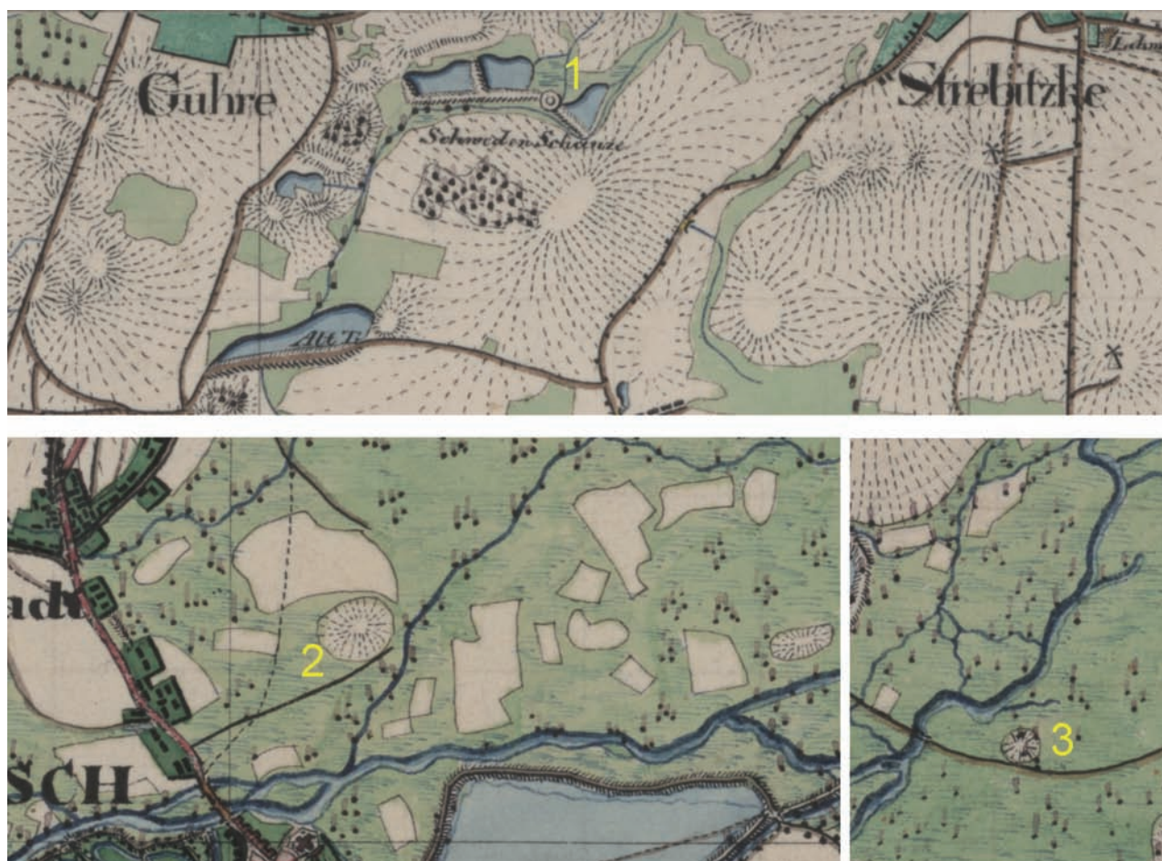
Abb. 5. Markierung der Burgwälle auf den Urmesstischblättern: 1 – Guhre, 2 – Militsch, 3 – Kasawe (SBB Preußischer Kulturbesitz, Sign. 729)