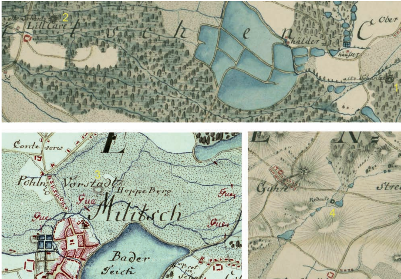
Abb. 4. Markierung der Burgwälle auf der Karte von Ch.F. Wrede. Nahaufnahme der Burgwälle in den Orten: 1 – Breslawitz, 2 – Lelikowe, 3 – Militsch, 4 – Guhre (SBB Preußischer Kulturbesitz, Sign. Karta. N 15060) Fig. 4. Strongholds marked on the map by Ch. F. Wrede. A close-up of strongholds from the following locations: 1 – Wrocławice, 2 – Lelików, 3 – Milicz, 4 – Góry (SBB Preußischer Kulturbesitz, cat. no. Kart. N 15060)

Militsch auf der Karte von Wieland, veranschaulicht damalige Unterschiede im Erkennungsgrad der Burgwälle im westlichen und östlichen Teil des ehemaligen Kreises Militsch-Trachenberg 39 .