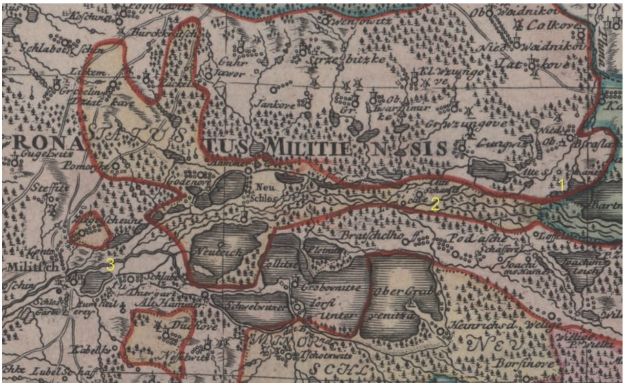
Abb. 3. Markierung der Burgwälle auf der Karte Principatus Silesiae Oelsnensis von J.W. Wieland und M. Schubarth (SBB Preußischer Kulturbesitz, Staatsbibliothek zu Berlin, Sign. Kart. N 14940): 1 – Breslawitz, 2 – Lelikowe, 3 – Militsch

Fig. 3. Strongholds marked on the map Principatus Silesiae Oelsnensis by J. W. Wieland and M. Schubarth (SBB Preußischer Kulturbesitz, Staatsbibliothek zu Berlin, cat. no. Kart. N 14940): 1 – Wrocławice, 2 – Lelików, 3 – Milicz