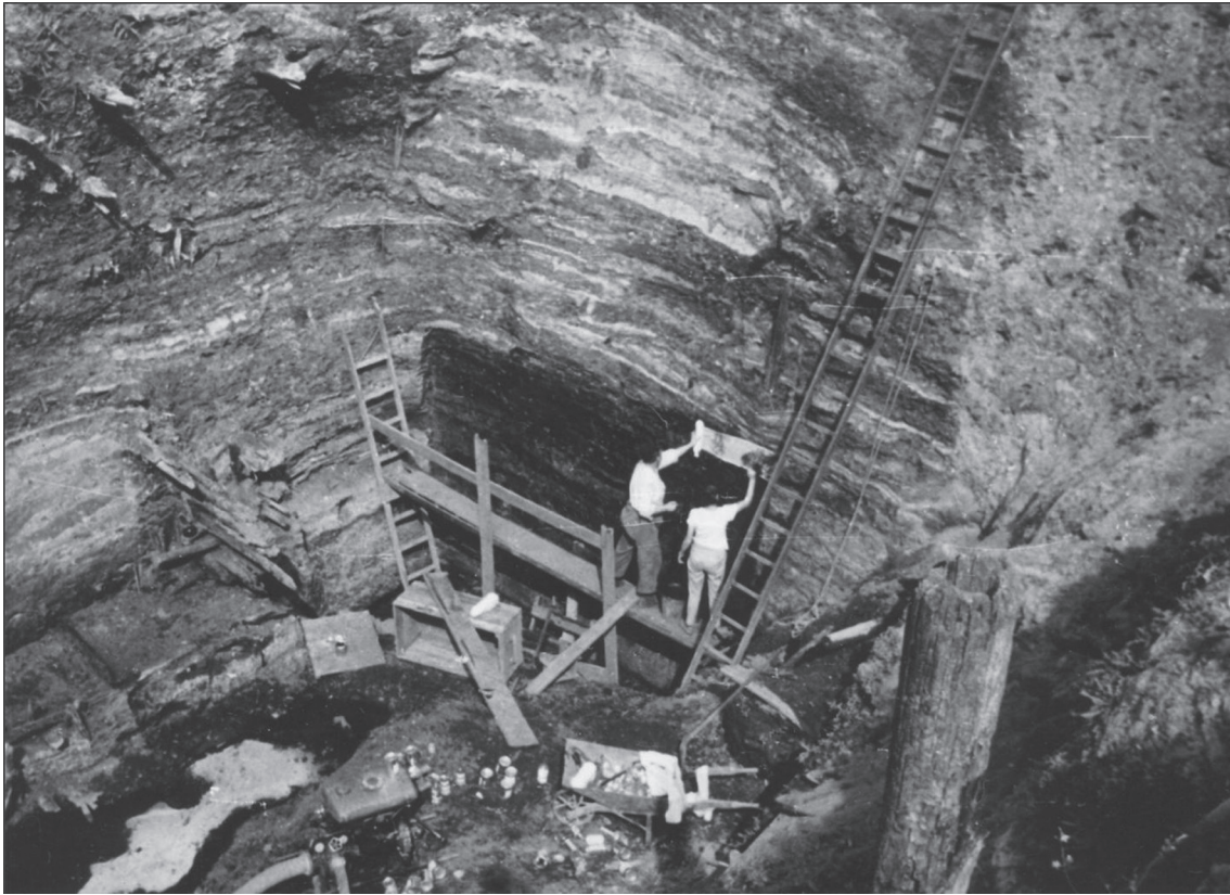
Ryc. 2. Szczecin. Profil wykopu na Rynku Warzywnym, 1963 r. Fig. 2. Szczecin. A profile of a trench on Rynek Warzywny, 1963.

prac ratowniczych przy jednoczesnym rozpoczęciu systematycznych wykopalisk, w trakcie których rozpoznawano i eksplorowano nawarstwienia kulturowe o znacznej miąższości. Początkowo, w latach 1953-1960, eksplorowano wykopy na wolińskim Starym Mieście, oznaczone numerami 4, 3 i 5 (ryc. 3-4). Miały one wielkości w granicach od 0,5 do 1,25 ara, a rejestrowano w nich nawarstwienia o miąższości przekraczającej nawet 8 m (Filipowiak 1955b; 1956; zob. Stanisławski 2013, 16-17). Jednocześnie w latach 1953-1959 ratownicze badania na cmentarzysku „Młynówka”, położonym na północnym skraju wolińskiego zespołu osadniczego, prowadził przybyły do Wolina absolwent Uniwersytetu Poznańskiego mgr Jerzy Wojtasik (Wojtasik 1968, 5 nn.; por. Filipowiak 1957). Od 1961 r. rozpoczęto również systematyczne badania Srebrnego Wzgórza.