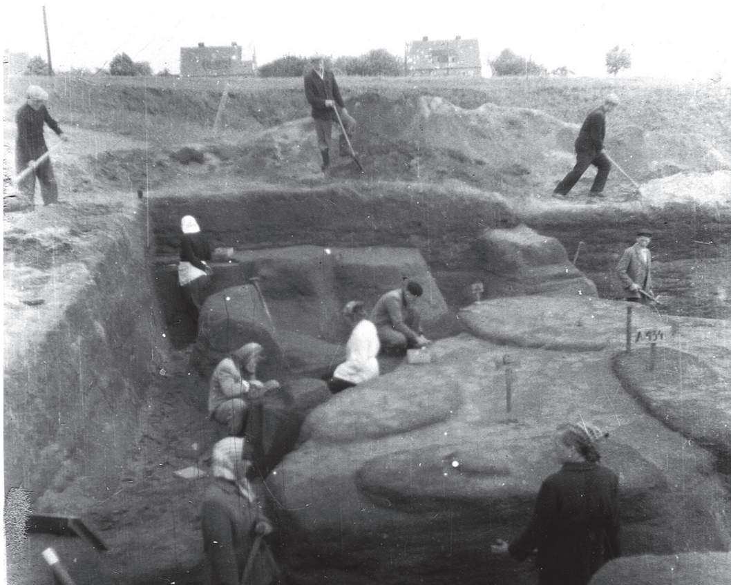
Ryc. 4. Wolin-Młynówka, 1956 r.

Fig. 4. Wolin-Młynówka, 1956.