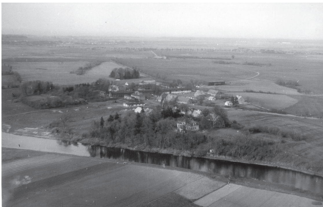
Ryc. 6. Zdjęcie lotnicze zespołu grodowego w Kołobrzegu-Budzistowie, 1960 r. Fig. 6. An aerial view of the stronghold complex in Kołobrzeg-Budzistowo, 1960.

Za pierwszą próbę chociaż schematycznego przedstawienia całości wyników badań szczecińskich na podstawie wykopu z Rynku Warzywnego uznać można drugi zeszyt z serii „Archaeologia Urbium”, przygotowany do druku przez czteroosobowe grono autorów (Leciejewicz et al. 1972). Kilkanaście lat później w pełni opracowano rezultaty badań osiągnięte w dobie milenijnej na wzgórzu grodowym i opublikowano je w jednym tomie wraz z wynikami badań nieco późniejszych (Cnotliwy et al. 1983). Pełną publikację źródeł z bardzo ważnego wykopu na Rynku Warzywnym otrzymaliśmy dopiero wiele lat później. Została ona przygotowana przez badaczy znacznie młodszego już pokolenia w ramach serii „Origines Polonorum”, która takim inicjatywom miała służyć (Kowalska, Dworaczyk 2011). Jeden z pierwszych tomów tej serii, wydany kilka lat wcześniej, ostatecznie su-