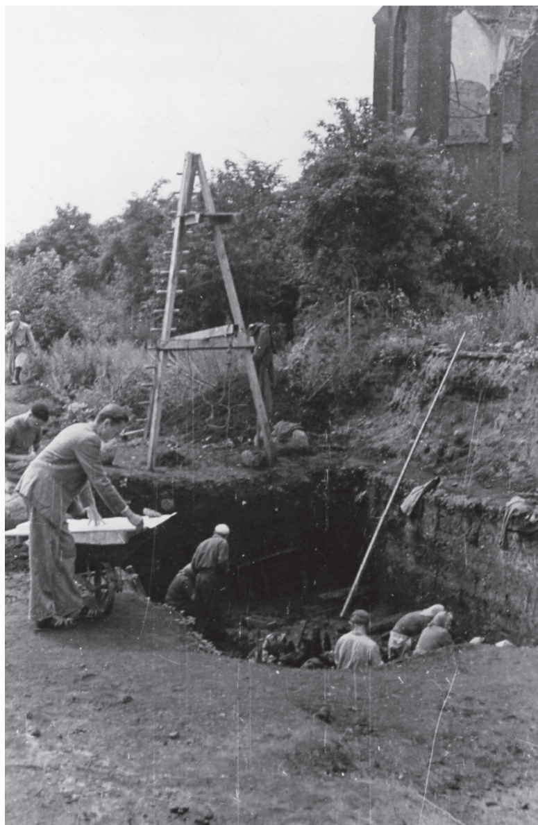
Ryc. 3. Wolin. Wykopaliska na Starym Mieście, stan. 4, 1954 r.

Fig. 3. Wolin. Excavations in Stare Miasto (Old Town), site 4, 1954.