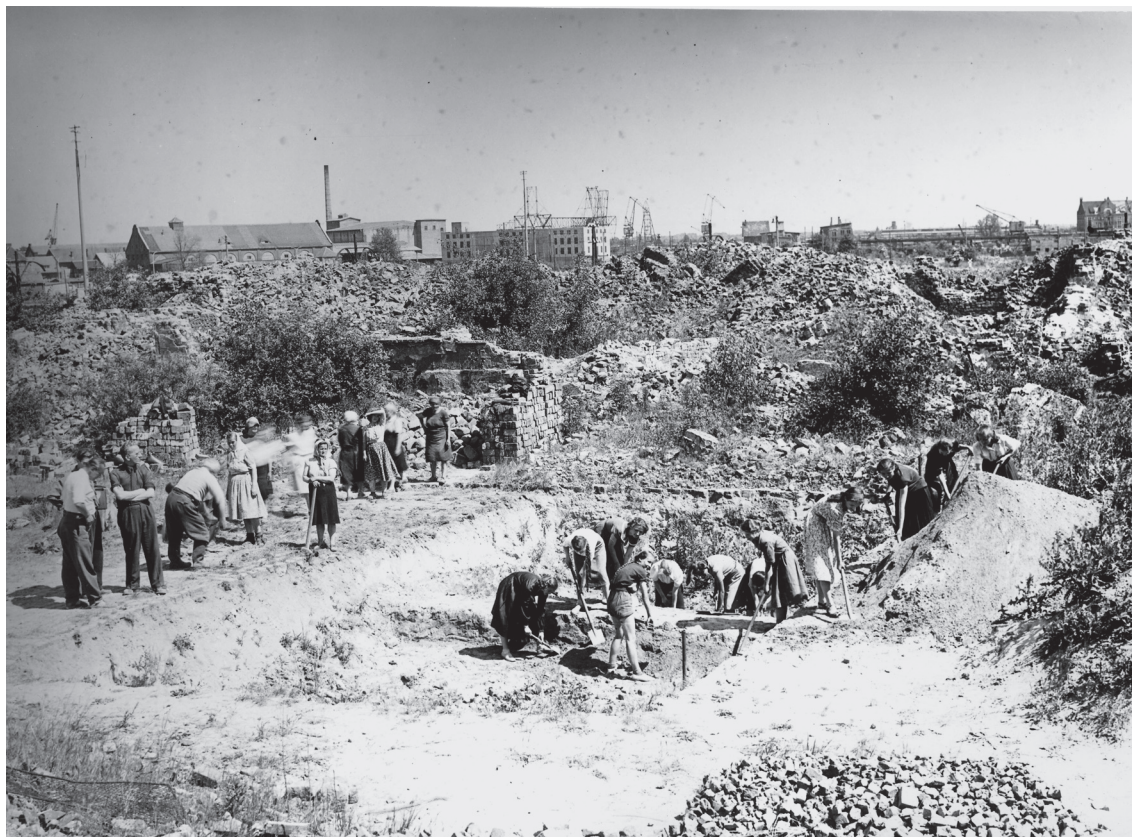
Ryc. 1. Szczecin. Początek badań na Rynku Warzywnym. Prawdopodobnie 1951 r. Widoczne powojenne zniszczenia miasta.