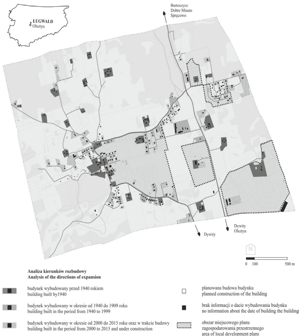
Ryc. 1. Analiza kierunków rozbudowy układu ruralistycznego wsi Ługwałd

Lokalizacja wsi Ługwałd na tle województwa warmińsko-mazurskiego Location of Ługwałd village in Warmia and Mazury Province