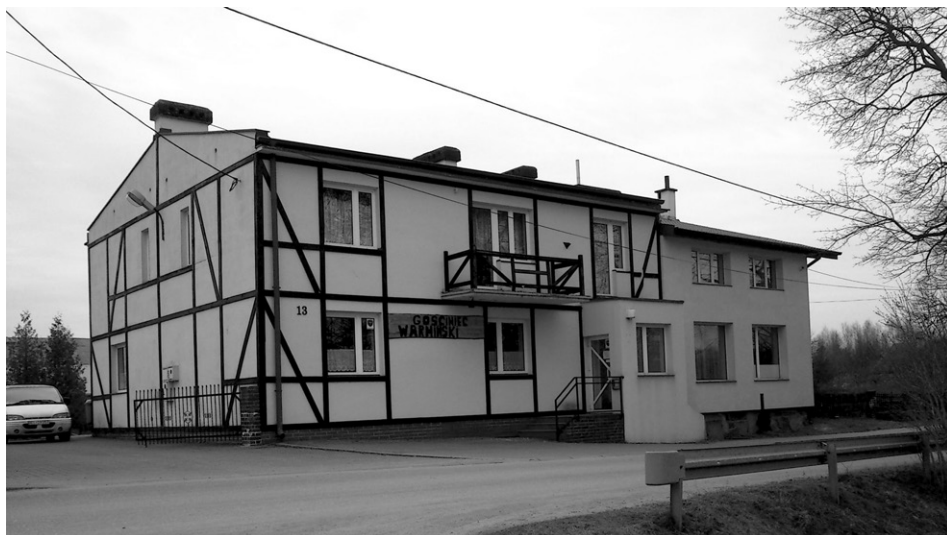
Fot. 6. Dysharmonijny budynek handlowo-usługowy w centrum wsi (fot. P. Pawelec, marzec 2015) An inharmonious retail and service building in the centre of the village (photo P. Pawelec, March 2015)