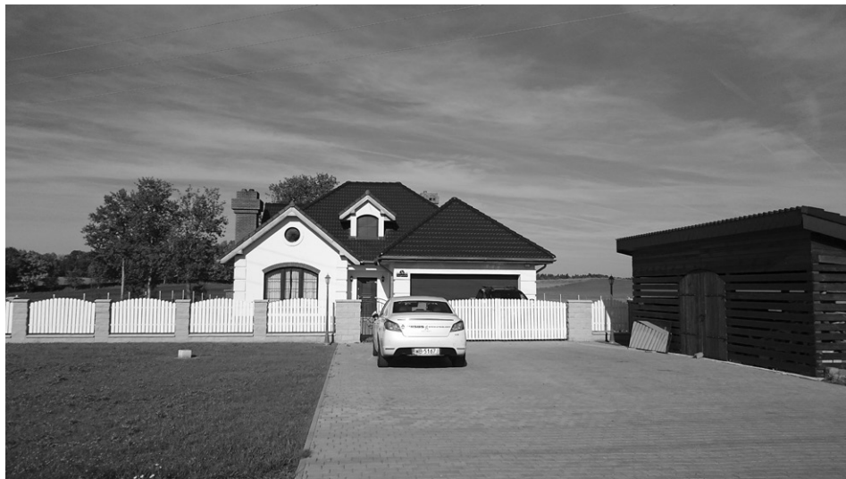
Fot. 5. Estetyczny, współczesny budynek niewpasowujący się w otoczenie (fot. P. Pawelec, październik 2015) An aesthetic modern building not fitting in the surrounding (photo P. Pawelec, October 2015)