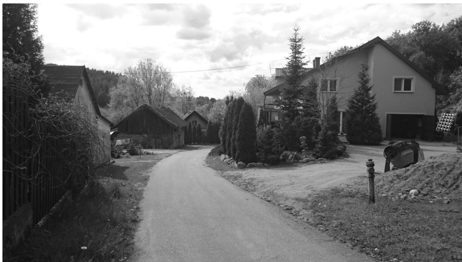
Fot. 7. Dysharmonijny budynek mieszkalny w otoczeniu historycznej zabudowy (fot. P. Pawelec, maj 2015) An inharmonious residential building surrounded by historic buildings (photo P. Pawelec, May 2015)