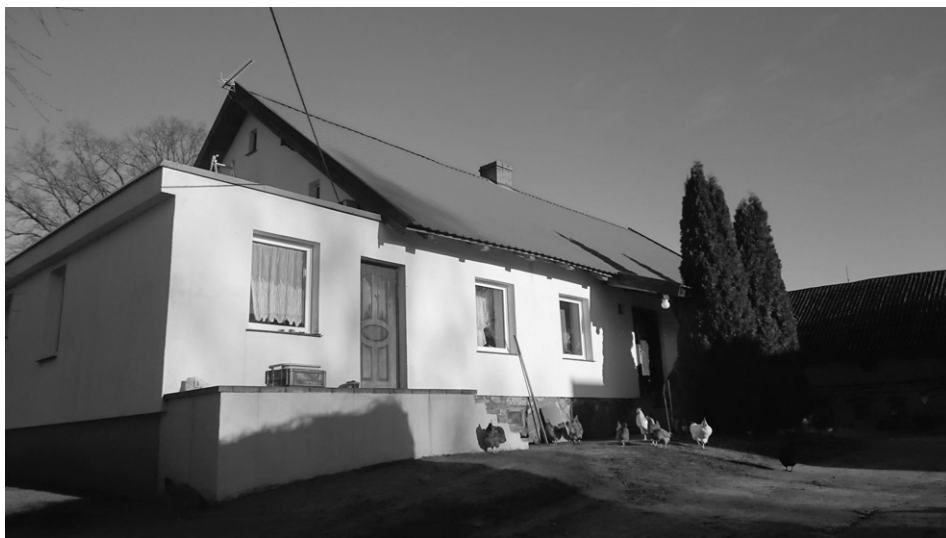
Fot. 3. Silnie przekształcony budynek mieszkalny (fot. P. Pawelec, listopad 2015) A highly converted residential building (photo P. Pawelec, November 2015)