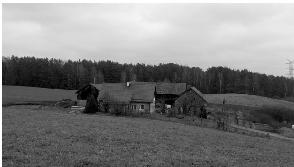
Fot. 2. Nieznacznie przekształcona zabudowa o układzie zagrodowym (fot. P. Pawelec, listopad 2015) A slightly converted building structure with a farmsteadlayout (photo: P. Pawelec, November 2015)