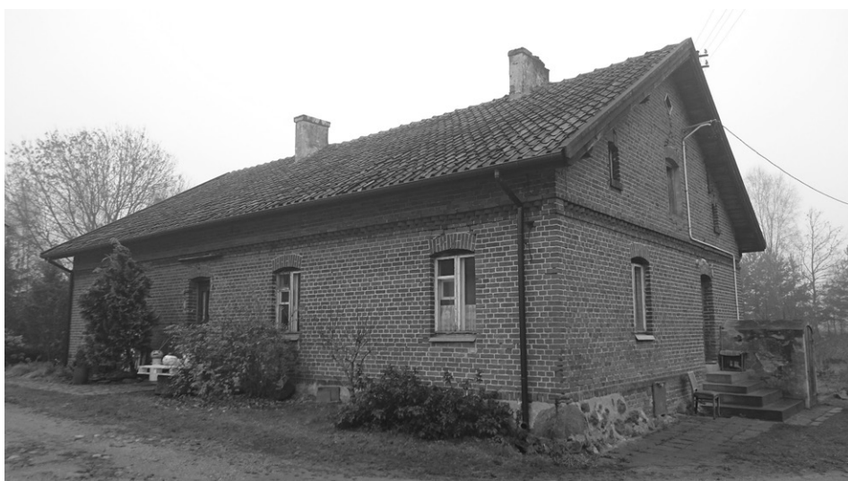
Fot. 4. Nieprzekształcony budynek mieszkalny (fot. P. Pawelec, listopad 2015) An unconverted residential building (photo P. Pawelec, November 2015)