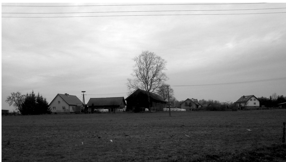
Fot. 8. Dysharmonijna zabudowa wsi (fot. P. Pawelec, marzec 2015) Inharmonious buildings of the village (photo P. Pawelec, March 2015)