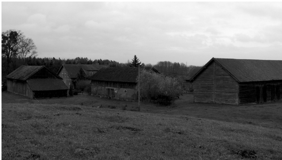
Fot. 1. Nieprzekształcona zabudowa o układzie zagrodowym (fot. P. Pawelec, listopad 2015) An unconverted building structure with a farmsteadlayout (photo: P. Pawelec, November 2015)