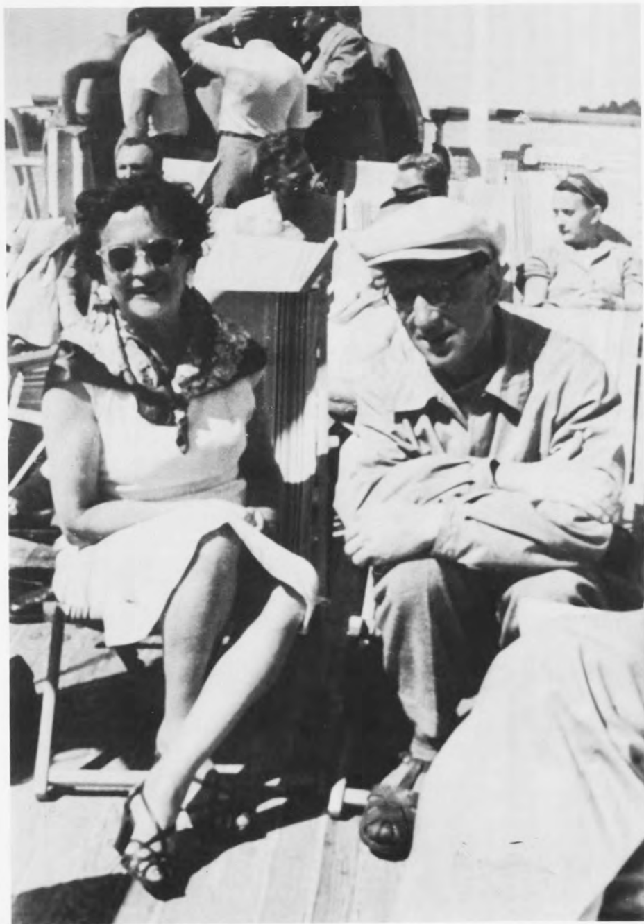
Artur Marya Swinarski i Magdalena Samozwaniec w 1956 r. (sygn. 1372)