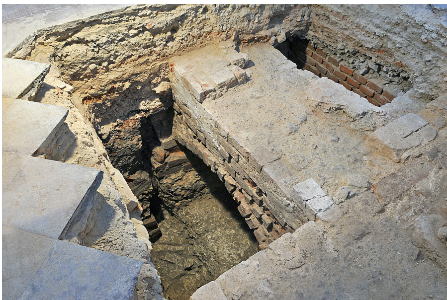
Ryc. 7. Fragment ceglanego muru ściany zachodniej świątyni z XIII w. (fundacja Daniela Romanowicza) odsłoniętego w 2013 r. pod posadzką obecnej bazyliki katedralnej. W murze widoczne sklepienie krypty grobowej.