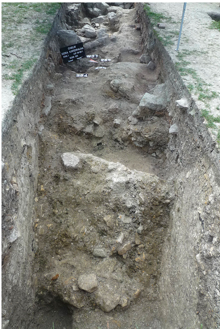
Ryc. 5. Warstwy spalonych destruktyw odsłonięte w wykopie nr 31 – archeologiczne świadectwa wielkiego pożaru z 1256 r. (?).