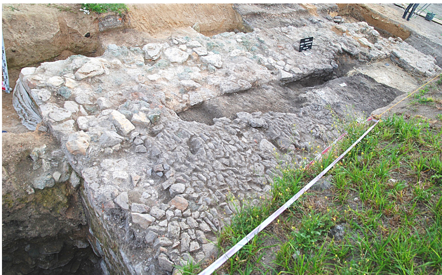
Ryc. 4. Relikty wieży kamiennej (tzw. budowla B), wkomponowanej w mur północny muru obwodowego rezydencji książęcej (por. ryc. 2). Obiekt w większej części zalega pod nowożytnym Kopcem Niepodległości. Widok z góry, od płn.-wsch.