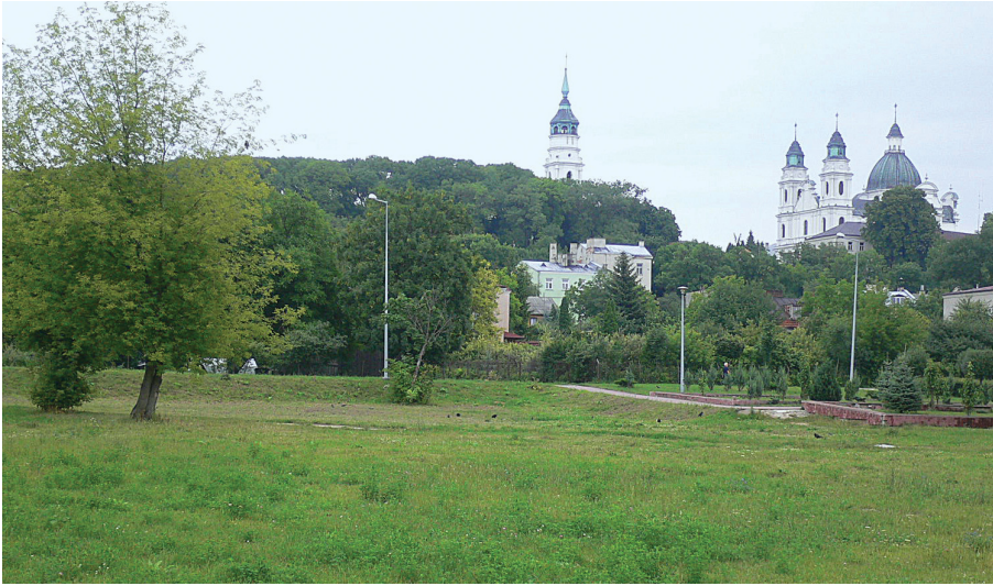
Ryc. 1. Góra Katedralna w Chełmie. Po lewej stronie widoczne wyniesienie Wysokiej Górki, na prawo — dzwonnica i bazylika katedralna Narodzenia NMP. Widok od zachodu.