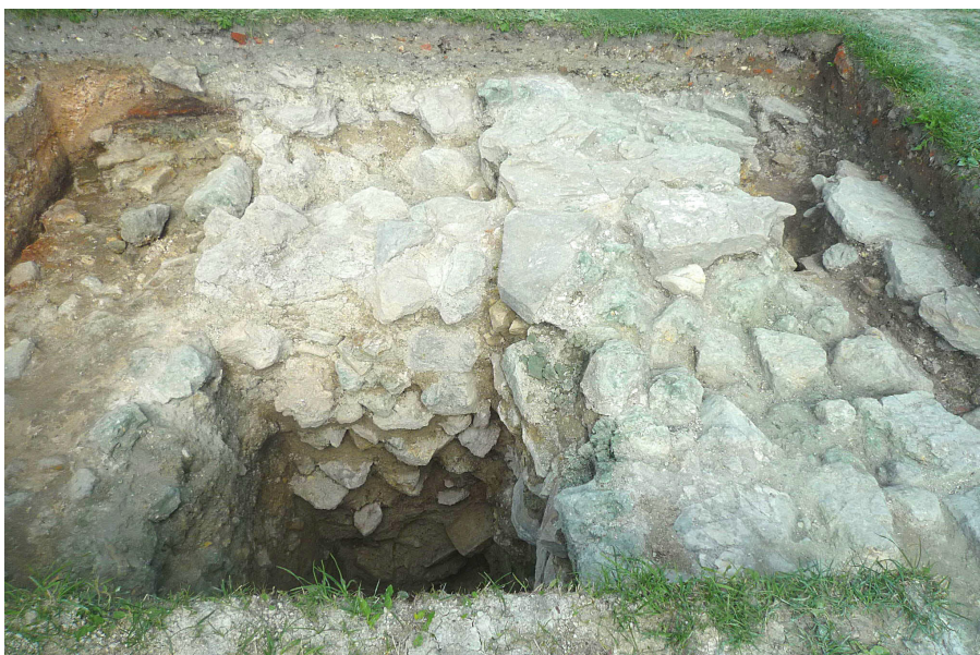
Ryc. 6. Podwójny mur — poszerzona ściana budowli sakralnej (?), tzw. budowla A: archeologiczne świadectwa naprawy po pożarze (?) z 1256 r.