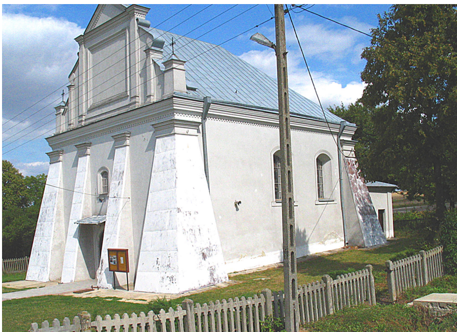
Ryc. 3. Kościół parafialny w Spasie-Podgórzu k. Chełma. W jego części prezbiterialnej i części nawy głównej zidentyfikowano budowlę sakralną datowaną na wiek XIII. Widok od płd.-zach.