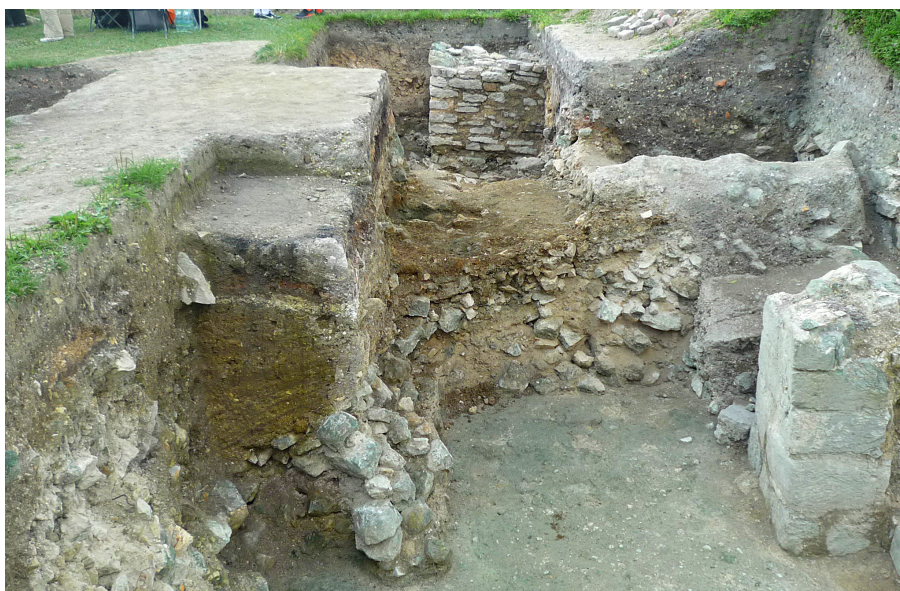
Ryc. 9. Odślonięte elementy rezydencji Danielowskiej fazy I oglądane od części bramnej (po prawej stronie). Powyżej poziomu posadzki (na pierwszym planie) zalega gruba warstwa materiałów budowlanych, na której budowano obiekty kolejnej fazy, w tym kamienną wieżę (budowla B) – widoczna u góry. Widok od wsch.