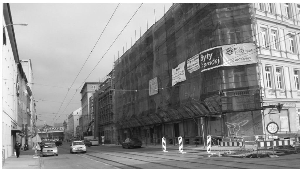
Fot. 6. Brno, ulice Cejl, protější strana domů s plakátem realitní kanceláře, fot. J. Pospíšilová, 2008 r.