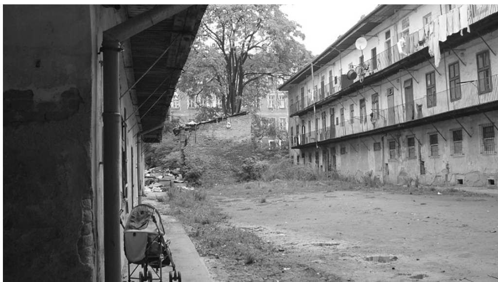
Fot. 4. Brno, ulice Cejl, pohled na dům č. p. 77 ze dvora, fot. J. Pospíšilová, 2007 r.