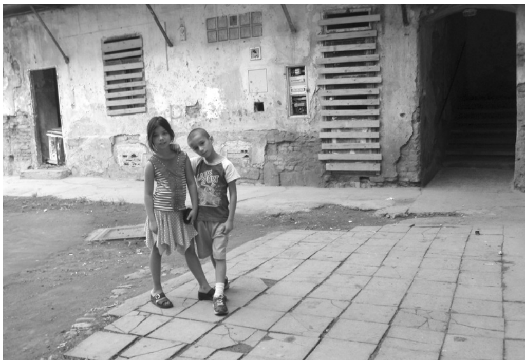
Fot. 8. Brno, ulice Cejl, hrající si děti ve dvoře domů č. p. 75 a 77, 2008 r.