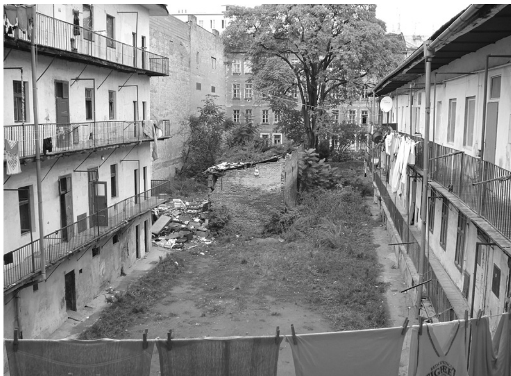
Fot. 5. Brno, ulice Cejl, pohled na dvůr domů č. p. 75 a 77 shora, fot. J. Pospíšilová, 2007 r.