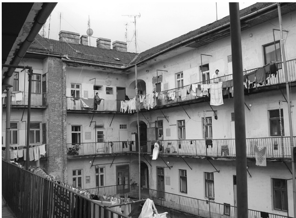
Fot. 3. Brno, ulice Cejl, společný dvůr domů č. p. 75–77, 2007 r.