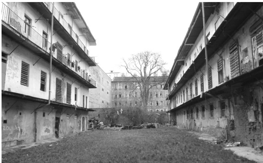
Fot. 7. Brno, ulice Cejl, společný dvůr domů už téměř vystěhovaných domů č. p. 75 a 77, fot. J. Pospíšilová, 2013 r.