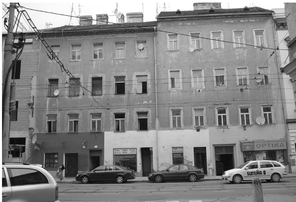
Fot. 2. Brno, ulice Cejl, průčelí domů č. p. 75 a 77, 2007 r.