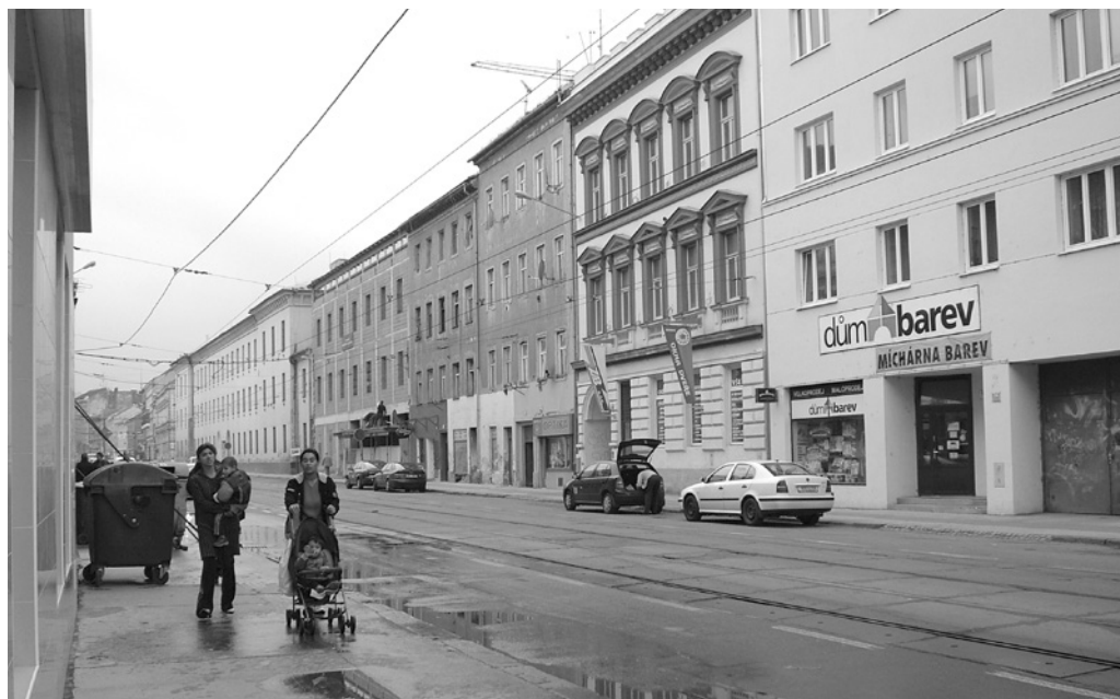
Fot. 1. Brno, ulice Cejl, pohled ke středu města, 2007 r.