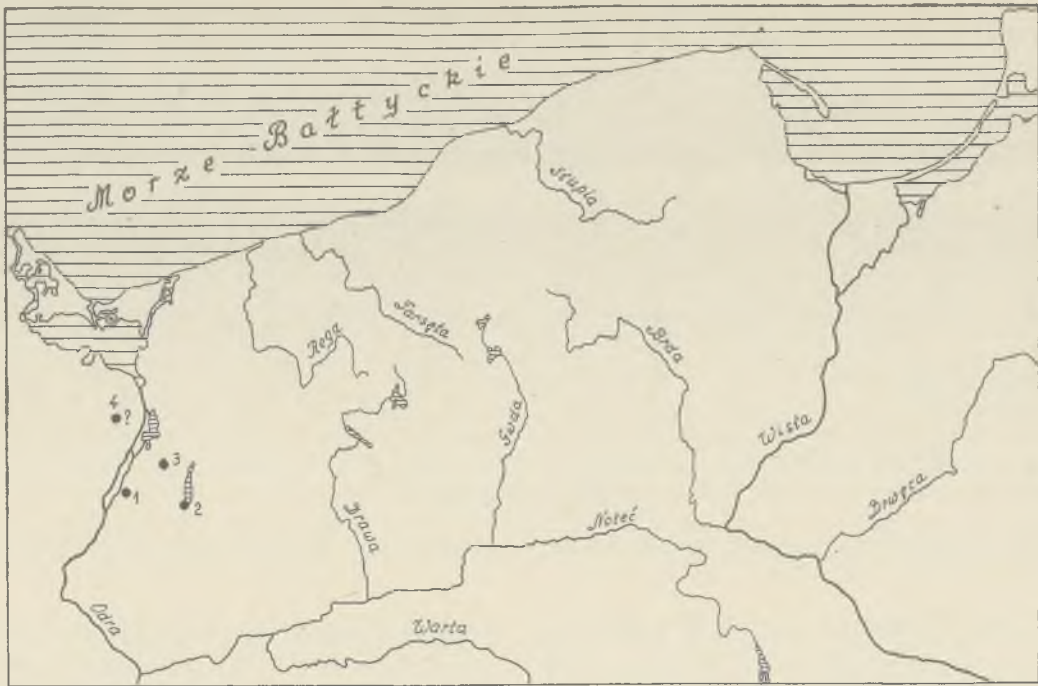
Ryc. 1. Talerze ozdobne i misa (4) z parzystymi otworami, w kulturze łużyckiej na Pomorzu Zachodnim

Turban-brim plates and bowls with twin openings in Lusatian culture in Western Pomerania