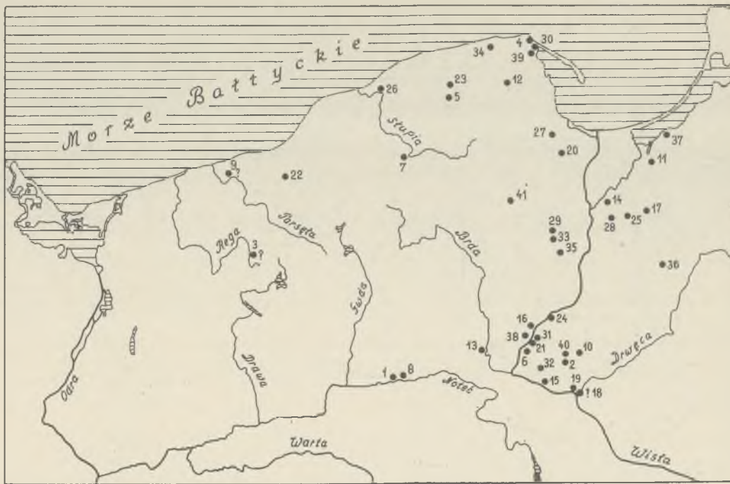
Ryc. 6. Groby podkloszowe w kulturze pomorskiej okresu halsztackiego C i D w północnej Polsce

Bell graves in the Pomeranian culture of the C and D Hallstatt periods in northern Poland