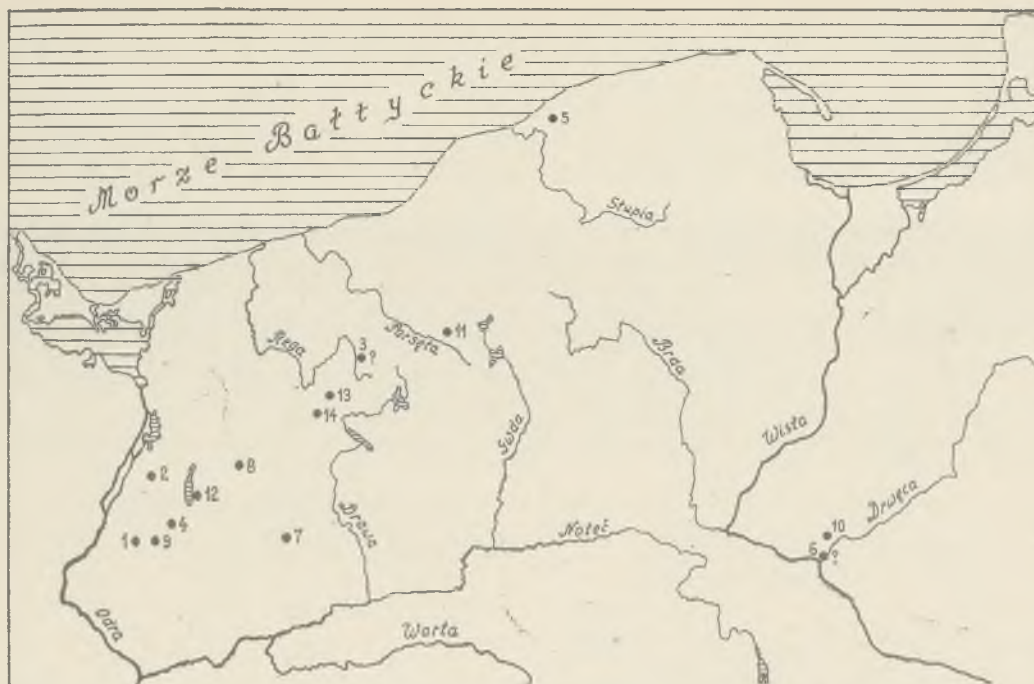
Ryc. 5. Groby podkloszowe w kulturze łużyckiej na Pomorzu

Bell graves in the Lusatian culture in Pomerania