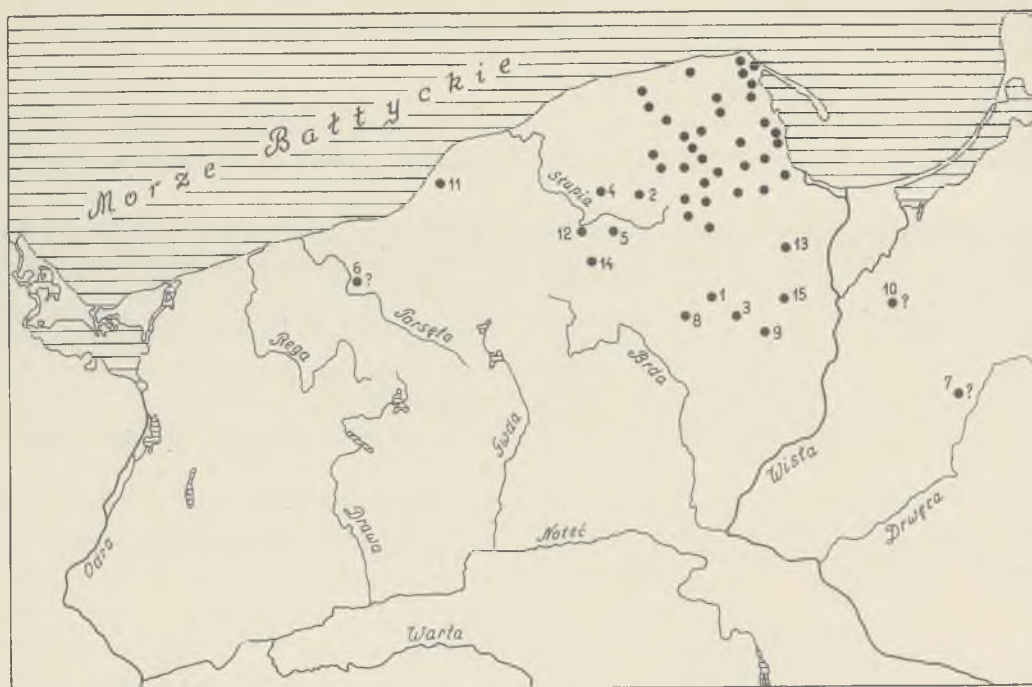
Ryc. 3. Popielnice i pokrywy oczkowe w kulturze pomorskiej okresu halszackiego C i D

Eye-bearing urns and covers in Pomeranian culture of the Hallstatt C and D periods