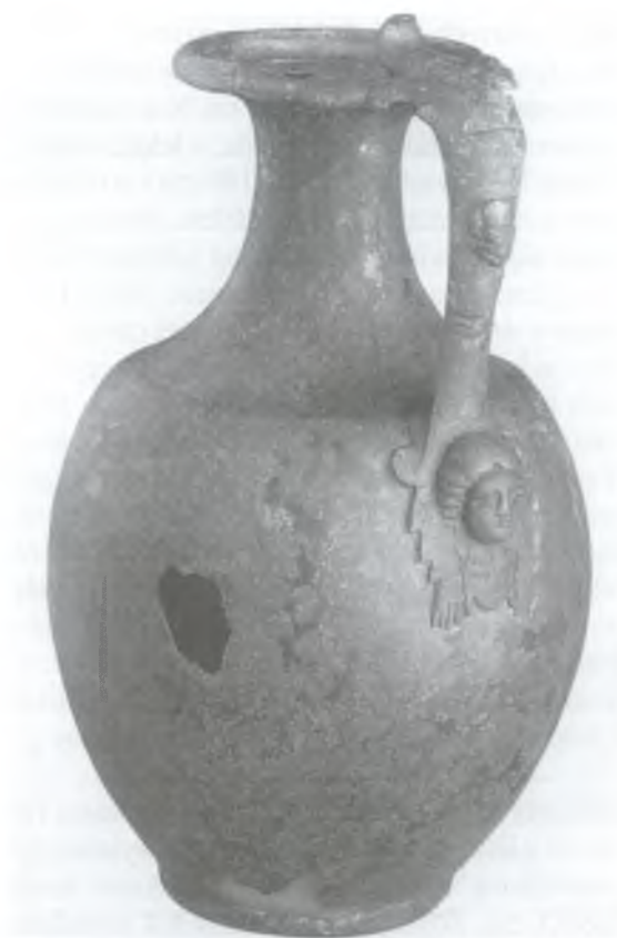
Fot. 1. Kowalewko, woj. poznańskie. Dzban brązowy Foto 2. Kowalewko, Woi. Poznań. Bronzekrug

mgr Tomasz Skorupka Muzeum Archeologiczne w Poznaniu ul. Wodna 27 61-781 Poznań