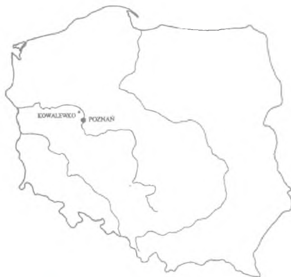
Ryc. 1. Kowalewko, woj. poznańskie. Usytuowanie stanowiska Abb. 1. Kowalewko, Woj. Poznań. Lage der Fundstelle

Odkryty dzban posiada 24,5 cm wysokości (wysokość wraz z liściem 26,1 cm), średnicę wylewu 9,3-9,4 cm, największą wydętość brzusca 15,8 cm, średnicę dna 8,8-9,1 cm. Został on wykonany z 4 niezależnych od siebie części, które następnie ze sobą połączono za pomocą lutowania. Składają się na nie: szyjka wraz z wylewem, brzusec i część przydenna, dno i uchwyt.