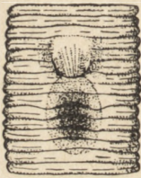
Abb. 2. Cystobranchus fasciatus (KOLLAR). Der äussere Bau der Clitellarregion. Bauchansicht.

Bei Prüfung des äusseren Körperbaus in der Clitellarregion beider mir zur Verfügung stehenden Exemplare [Abb. 2] kam ich zu anderen Ergebnissen als LISKIEWICZ (1934). Nach diesem