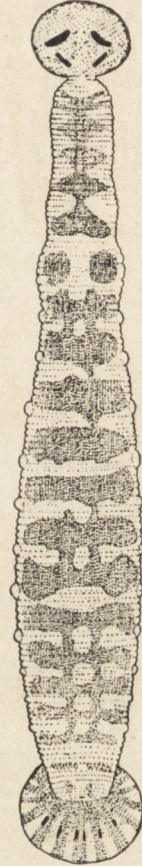
Abb. 1. Cystobranchus fasciatus (KOL-LAR). Rückenansicht.

Die grösste Körperbreite der von mir untersuchten Exemplare befand sich beim 7-en Atembläschenpaar. Die Exemplare von LISKIEWICZ waren am breitesten in der Gegend des 9-en Paares, während BLANCHARD die grösste Breite des Tieres beim