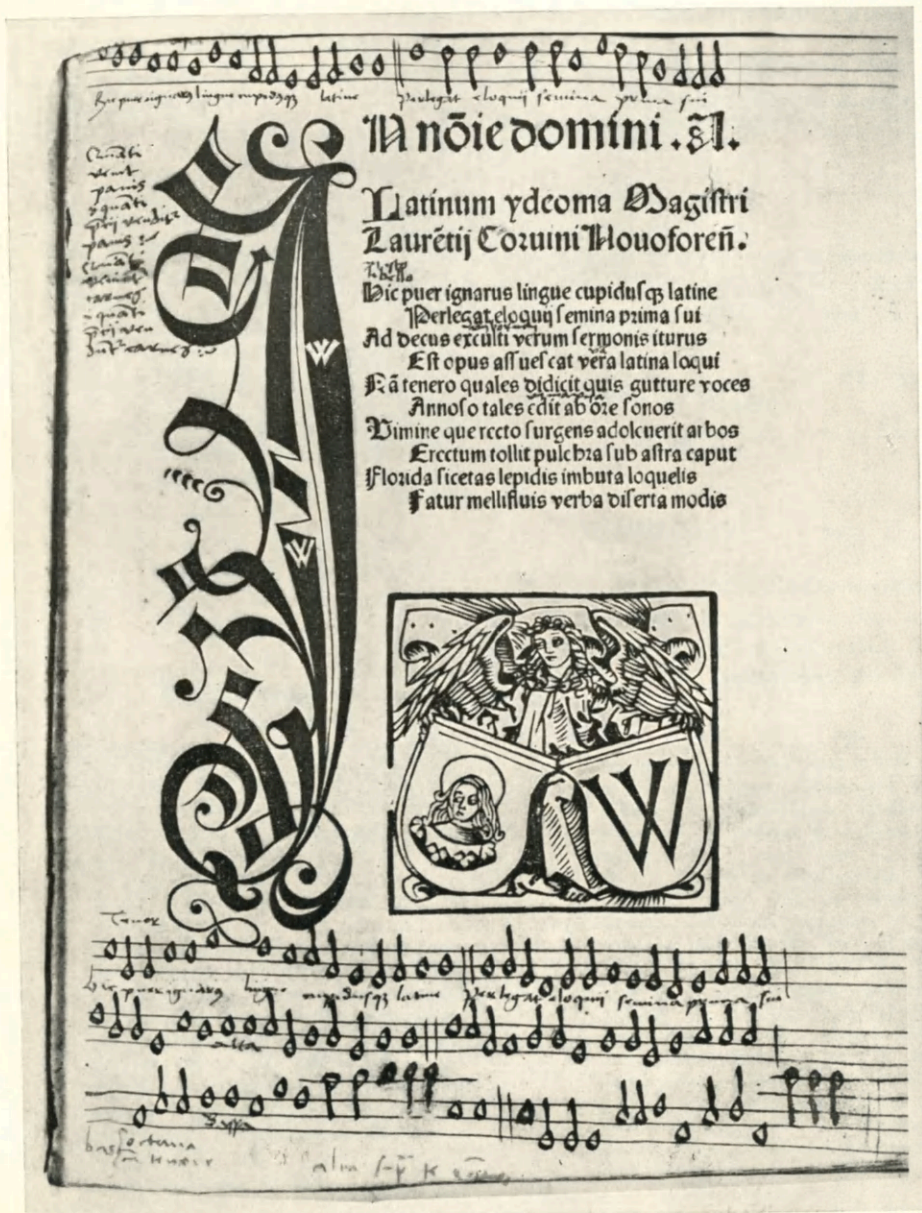
Tabl. VII. Nr. kat. 81. L. Corvinus: Latinum idioma. Wroclaw, 1503. 4 o . Karta tytułowa.