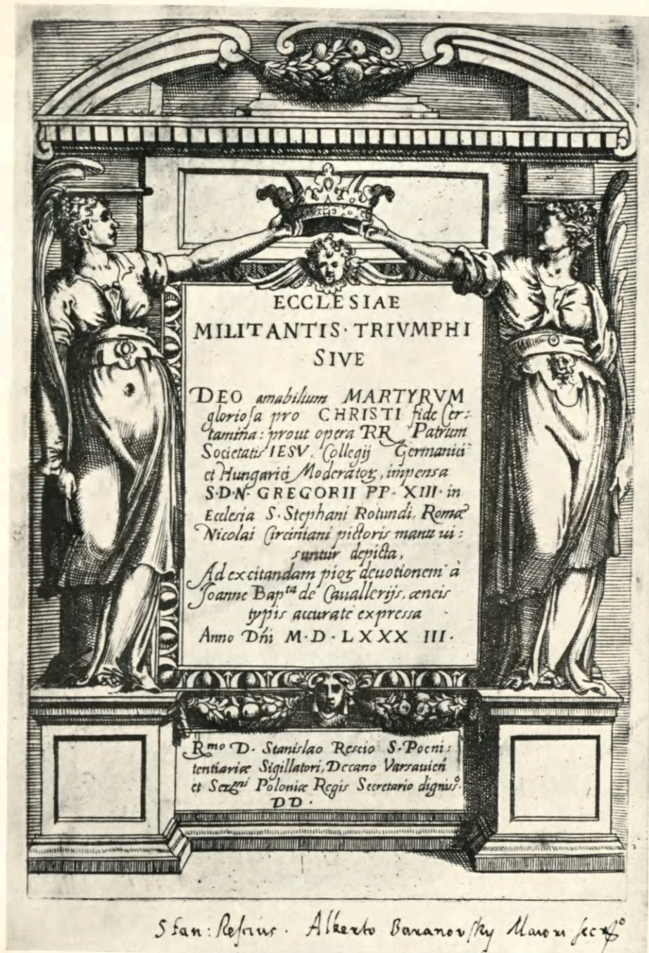
Tabl. VI. Nr. kat. 56. I. B. Cavalieri: Ecclesiae triumphi. Roma, 1584. 2 o . Karta tytułowa.