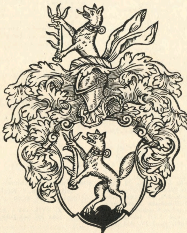
Tabl. VIII. Nr. kat. 102. Exlibris Samuela Wolfa.