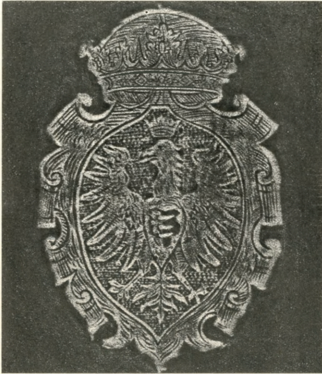
Tabl. X Nr. kat. 323. Superexlibris króla Stefana Batorego.