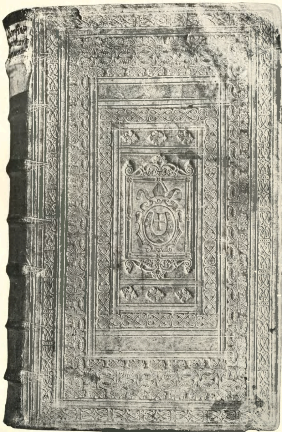
Tabl. I. Nr. kat. 39. Oprawa książki prymasa Wojciecha Baranowskiego.