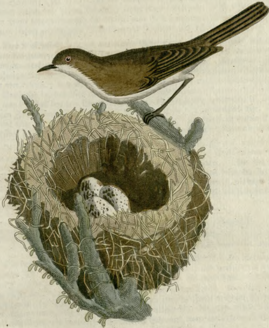
Die rostfarbene Grasmücke.