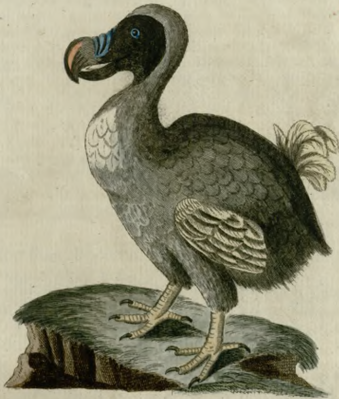
Der gemeine Dūdū.