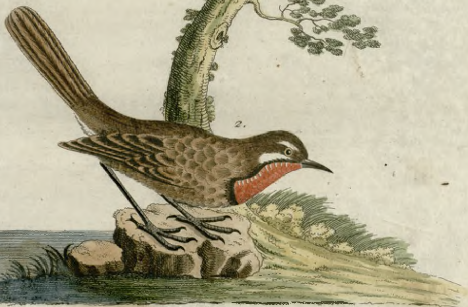
1. Der Stachelschwänzige Sänger.