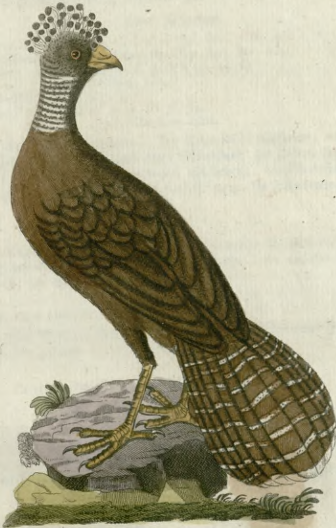
Das Weibchen des gekrönten Hoenes