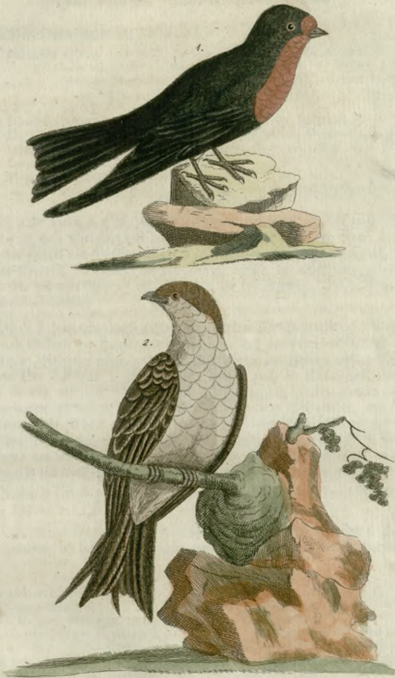
1. Die Otakeitische Schwalbe. 2. Die rothkopfige Schwalbe.