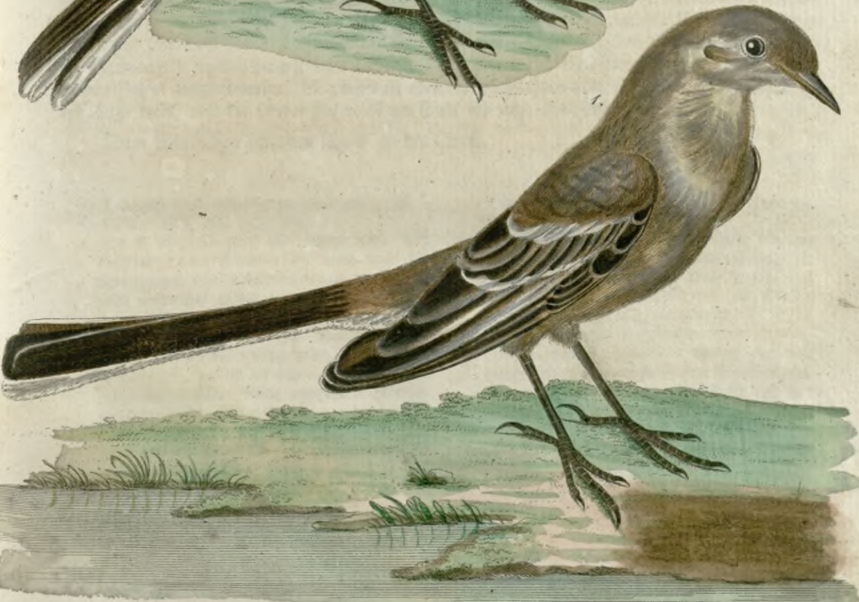
1. Das Junge der weißen Bachstelze. 2. Das Junge der gelben Bachstelze.