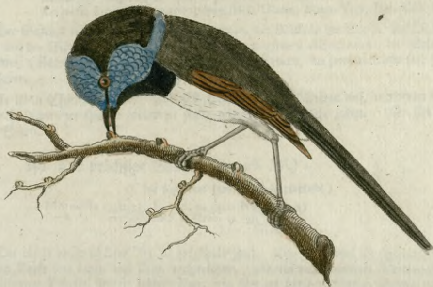
Der prächtige Sänger.