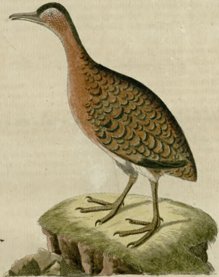
Der gefleckte Finamú