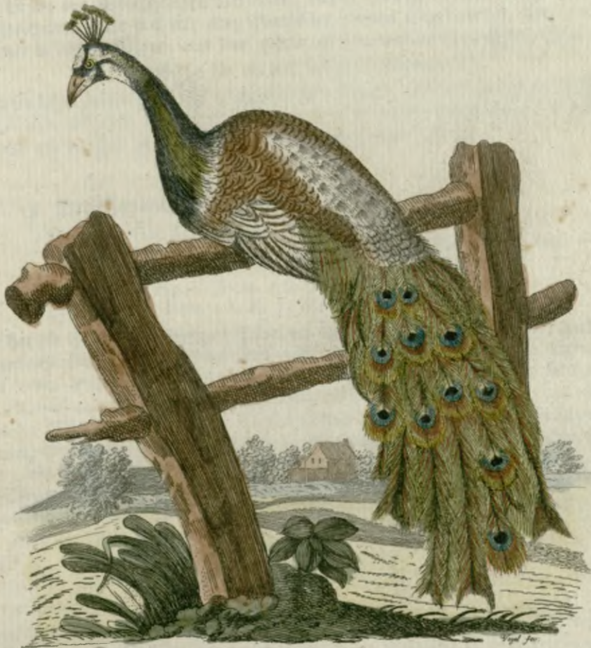
Eine Kohnfederige Pfauhenne.