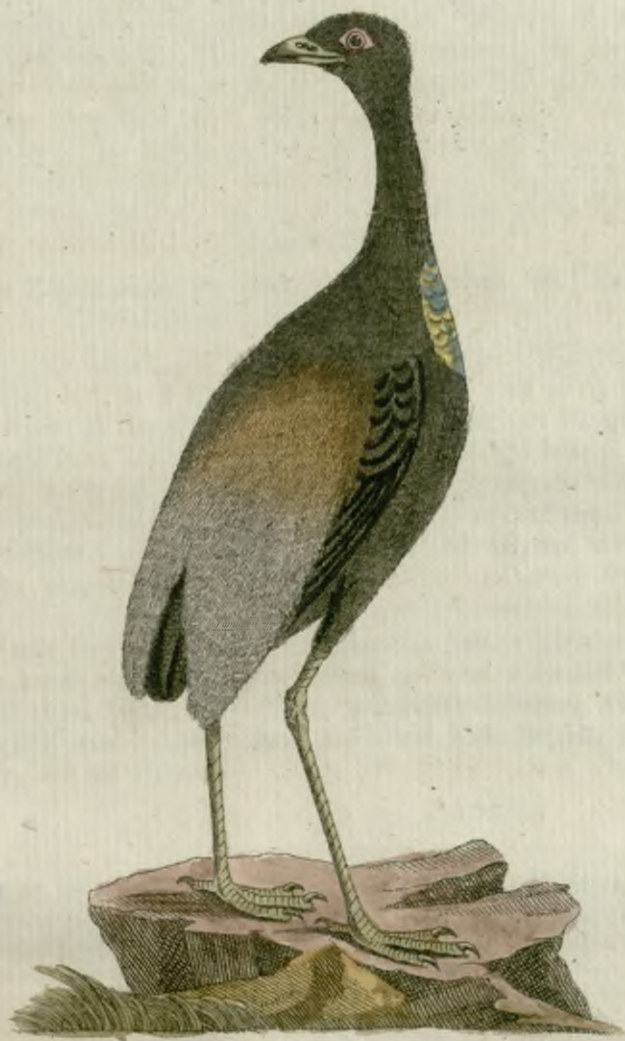
Der Goldbrächtige Trompetenvogel.