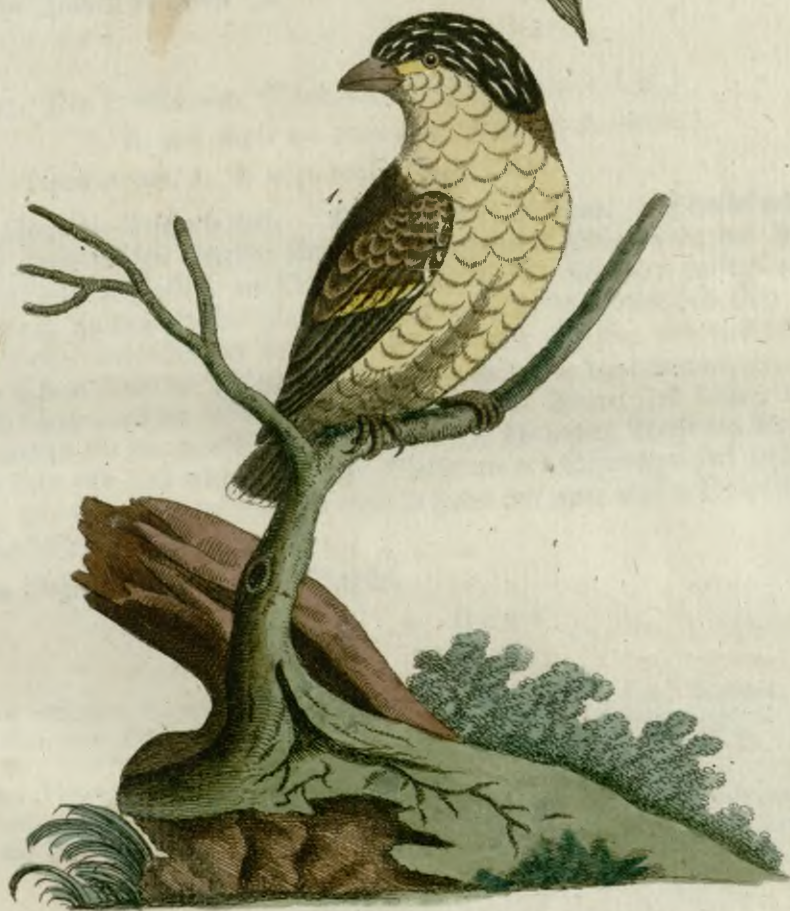
1. Der gestreiftköpfige Manakin. 2. Die großköpfige Meise.