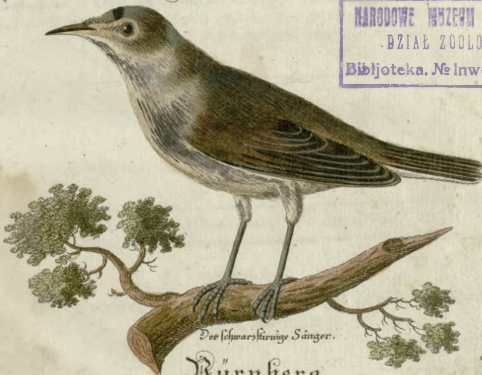
Der schwarzköpfige Sänger.