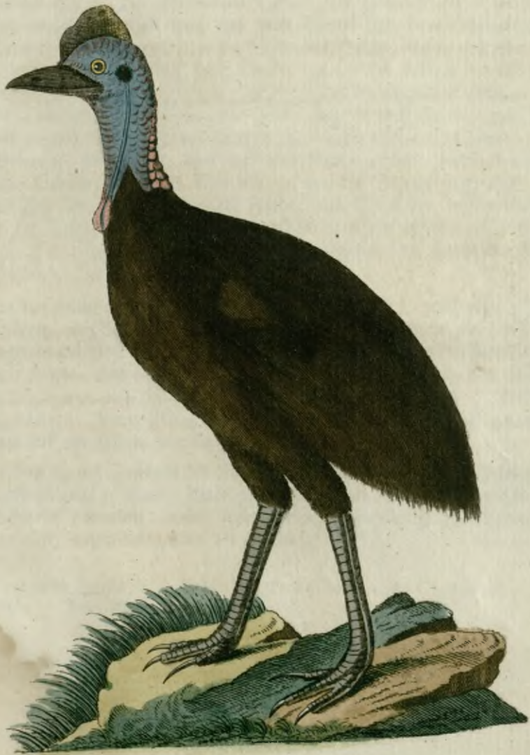
Der gehelmte Casuar.