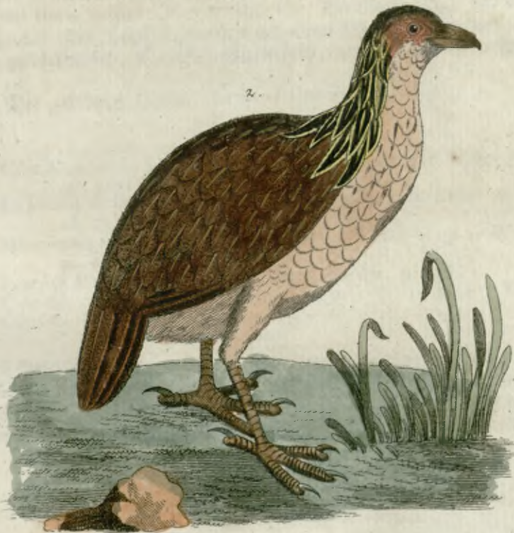
1. Das gehaubte Perlhuhn 2. Das Kragenrebhuhn