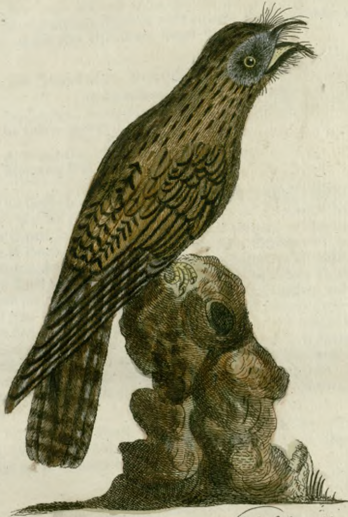
Die Jamaikaische Nachtschwalbe.