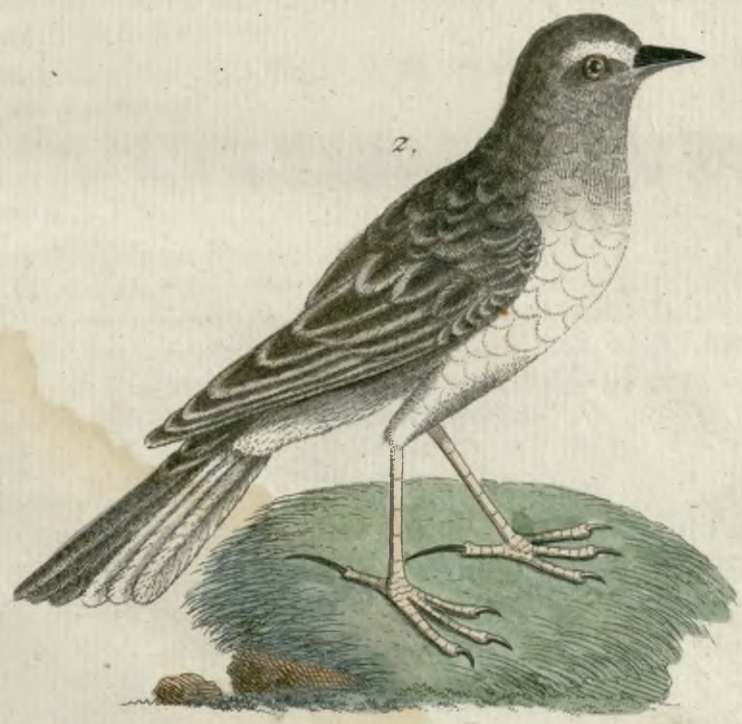
1. Die Pieplerche. 2. Die Neuseeländische Lerche.