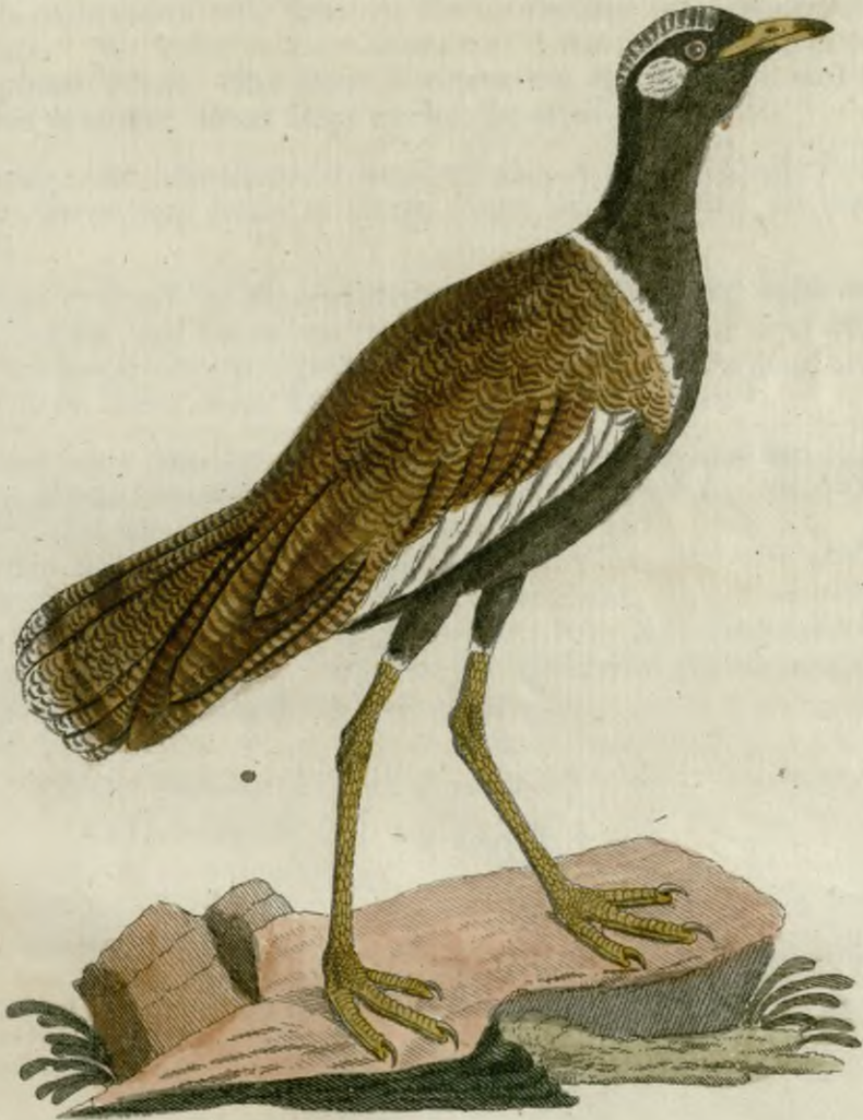
Der Weißföhrlige Trappe