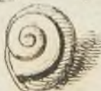
Fig. 13 p. 150