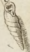
Fig. 4 a