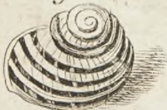
Fig. 16 p. 171