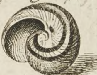
Fig. 14 p. 169