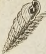
Fig. 4 b