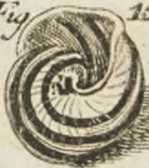
Fig. 15 p. 170