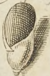
Fig. 2 p. 129. 30