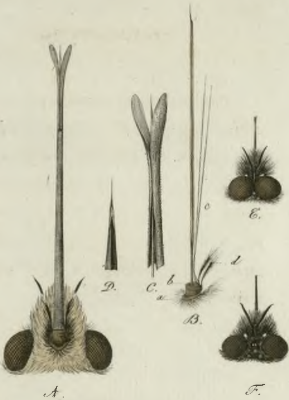
A. Caput Bomb: concoloris auctum a parte inf: B. Ori demta vagina. a. Margo semilunaris b. Tribula. c. Seta. d. Palpi. C. Apex valv: inferioris. D. superi: oris. E. Caput Bomb: atrivagus. F. femina.