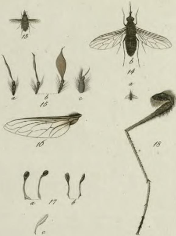
13. B. maurus 14. a. b. B. pulicarius 15. Antenna magn. auct. a. B. sinuati . b. pitvi . c. mauri . 16. Ala B. stenopteri aucta. 17. Halteres aucti a. B. sinu- ati . b. atri . c. pulicarii . 18. Leg. B. concoloris auctus.