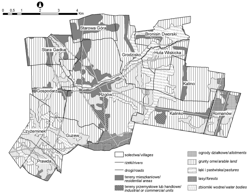
Ryc. 2. Formy wykorzystania terenu w gminie Rzgów • Land cover in Rzgów municipality