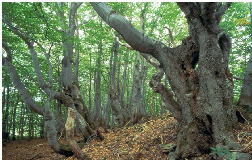
Fot. 4. Pnie zdeformowanych przez zwierzęta buków popastwiskowych (Bieszczady Wysokie)

dotyczące formacji roślinnych jako całości, zaś determinują i lokalnie różnicują tempo, dynamikę i charakter renaturalizacji sfery biotycznej. Przykładowo dla Bieszczadów Wysokich specyficzne są cechy górnej granicy lasu (wysokość, przebieg, stopień rozwinięcia) i procesy zachodzące w jej obrębie, zwłaszcza bardzo niskie tempo i dynamika sukcesji, determinowane przede wszystkim czynnikami klimatyczno-edaficznymi oraz właściwościami biologicznymi buka (Zarzycycki, 1963; Kucharzyk, 2004). Z drugiej strony w skali ponadregionalnej istnieją podobieństwa budowy i zwartości owych ekotonów, co wykazał S. Kucharzyk (2006) analizując, na podstawie zdjęć satelitarnych, górne granice lasu bukowego w całych Karpatach Wschodnich – od Bieszczadów Zachodnich po góry Rodniańskie i Bystrzyckie. Samo formowanie tzw. antropogenicznej granicy lasu w wyniku wielowiekowego wypasu jest wręcz zjawiskiem powszechnym (Mróz, 2006; Troll i Sitko, 2006), a tylko stopień jej antropizacji jest różny (Wolski, 2008a).