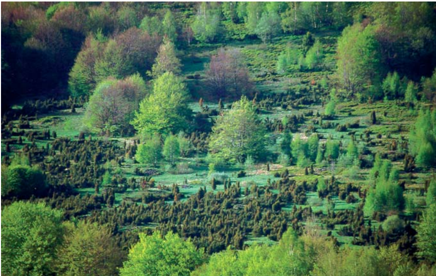
Fot. 5. Zarastające polany śródleśne na stokach Połoniny Wetlińskiej (Bieszczady Wysokie)

żeje skład florystyczny (Prochal i inni, 1966). Zarastanie gruntów porolnych przez olszę szarą występuje od Bieszczadów po Beskid Śląski (Tokarz, 1975), a także w innych regionach górskich Europy (Tasser i inni, 2003), jednak wybitna ekspansywność tego gatunku i spontaniczność procesu cechują przede wszystkim Bieszczady Zachodnie i Beskid Niski (Kulig i inni, 1974). Charakter przynajmniej ponadregionalny mają popastwiskowe formy buków (fot. 4), jaworów i świerków, notowane m.in. w Bieszczadach Wysokich (Wolski, 2007), Beskidzie Niskim (Przybylska i inni, 2006) i Beskidzie Żywieckim (Łajczak, 2005), a także ziołorośla szczawiu alpejskiego, będące indykatorem terenów powypasowych zarówno w Karpatach Wschodnich (Nesteruk, 2001), jak i Karpatach Zachodnich oraz Sudetach (Mirek i Skiba, 1984).