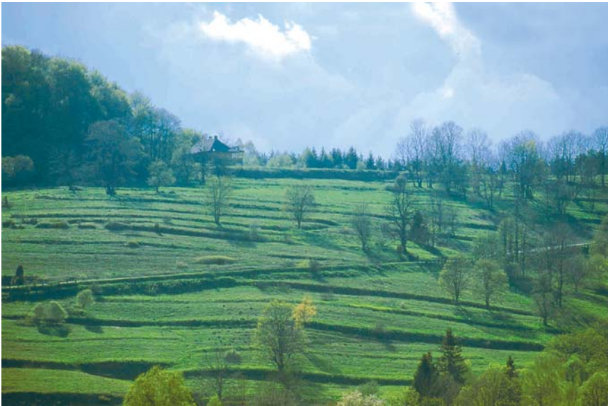
Fot. 1. Zachowany układ skarp tarasów i miedz śródpolnych Existing structure of scarps of cultivation terraces and baulks (Bieszczady Mountains)

Występowanie skarp tarasów i miedz śródpolnych notowane jest powszechnie w opuszczonych i wyludniających się wsiach lub na porzuconych gruntach rolnych w Karpatach (Gerlach, 1966; Łajczak, 2005; Wolski, 2006), Sudetach Wschodnich (Salwicka, 1978; Latocha, 2007), Pirenejach (Poyatos i inni, 2003), a jak twierdzi J. Baudry (1991) – w regionach górskich całej strefy śródziemnomorskiej. Gęstość tych form na stokach, silnie zróżnicowana lokalnie, determinowana jest historycznym układem gruntów, zaś stan zachowania stanowi wypadkową procesów denudacyjnych i pokrycia terenu oraz oddziaływań antropogenicznych. Na przykład w Bieszczadach Wysokich (fot. 1) stopniowy zanik skarp tarasów rolnych i miedz śródpolnych zależy od: