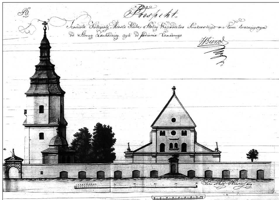
Ryc. 1. Prospekt Kościoła Collegiaty Miasta Kielce Stolicy Województwa Krakowskiego w stanie teraźniejszym od Strony Zachodniej, czyli od podcienia Zamkowego , rys. W. Giersz, ok. 1820 r., Archiwum Główne Akt Dawnych w Warszawie, Komisja Rządowa Spraw Wewnętrznych, sygn. 2424, k. 152

Fig. 1. “The Collegiate Church of the City of Kielce in the present condition viewed from the west, or from the castle arcades”, drawn by W. Giersz, c. 1820, Archiwum Główne Akt Dawnych w Warszawie, Komisja Rządowa Spraw Wewnętrznych, no. 2424, k. 152