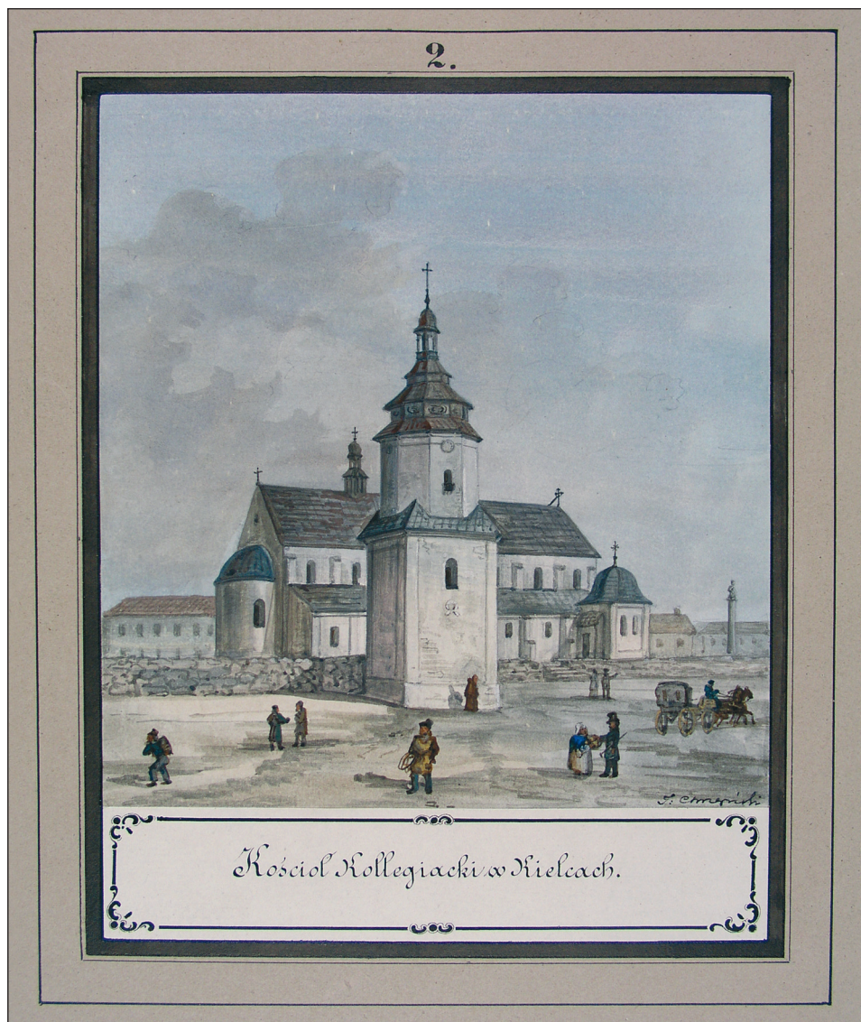
Ryc. 2. Kościół Kolegiacki w Kielcach, Atlas I, tabl. 2, rys. T. Chrząński, 1844–1846, [w:] Widoki Zabytków Starożytności w Królestwie Polskim służące do objaśnienia opisu tychże starożytności, sporządzonego przez Delegację wysłaną z polecenia Rady Administracyjnej Królestwa w latach 1844 i 1846 zebrane. Atlas 1. Gubernia Radomska, Powiaty: kielecki, miechowski, olkuski i stobnicki , 1850, Biblioteka Uniwersytetu Warszawskiego, Dział Rycin