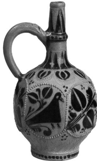
Abb. 10. Steinzeugkrug aus dem 18. Jh. in den Sammlungen des Rheinischen Landesmuseums in Trier (nach: Seewaldt 1990, 134)

Zwar spielte im späten Mittelalter und im 16. Jh. in Nowy Korczyn die Bierbrauerei eine große Rolle (Kiryk 1994, 79), doch ein Zusammenhang zwischen diesem Umstand und dem einzelnen Fund eines Steinzeugkrugs lässt sich schwerlich zu beweisen. Am meisten plausibel ist es solche Funde mit dem Getreidehandel zu verbinden. Das Getreide wurde nämlich auf der Weichsel nach Gdańsk geflößt und Nowy Korczyn spielte dabei eine wichtige Rolle (Gierszewski 1982, 35–128). Die meisten Funde der rheinischen Steinzeugwaren aus Polen, sowohl spätmittelalterliche als auch solche aus dem 16. und der erste Hälfte des 17. Jhs., stammen aus den Ausgrabungen in Gdańsk, Elbląg und Kolobrzeg [Danzig, Elbing und Kolberg]. Die