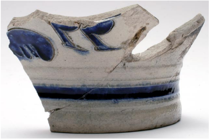
Abb. 7. Nowy Korczyn, Kreis Busko-Zdrój, Farna-Straße. Fragment eines Steinzeuggefäßes Ryc. 7. Nowy Korczyn, pow. Busko-Zdrój, ul. Farna. Fragment kamionkowego naczynia