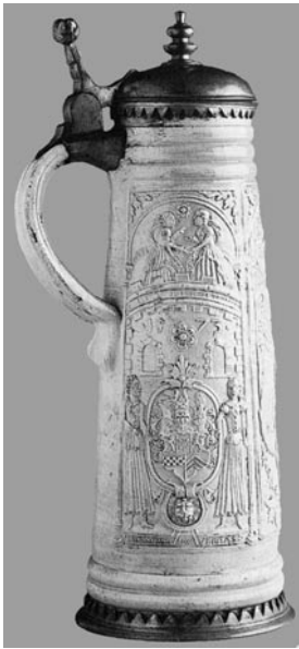
Abb. 3. Schnelle aus dem Jahr 1573 in den Sammlungen von British Museum. Rechte Seite (nach: Gaimster 1997, 181, Abb. 20)

Es gelangte sogar bis in die Städte Osteuropas, was Funde von Bruchstücken rheinischen Steinzeuggefäßen mit figurativer und architektonischer Verzierung aus Pskow (Iwa-