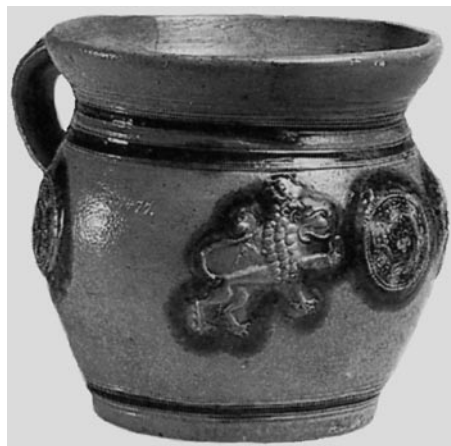
Abb. 9. Steinzeugkrug von 1632 in den Sammlungen des Rheinischen Landesmuseums in Trier (nach: Seewaldt 1990, 133)

Ryc. 8. Garnek kamionkowy z połowy XVII w. w zbiorach Reńskiego Muzeum Regionalnego w Trewirze. (wg P. Seewaldt 1990, s. 133)