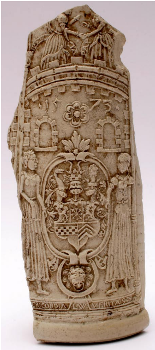
Abb. 2. Nowy Korczyn, Kreis Busko Zdrój, Zamkowa-Straße. Fragment einer Schnelle Ryc. 2. Nowy Korczyn, pow. Busko Zdrój, ul. Zamkowa. Fragment kamionkowego kuffla