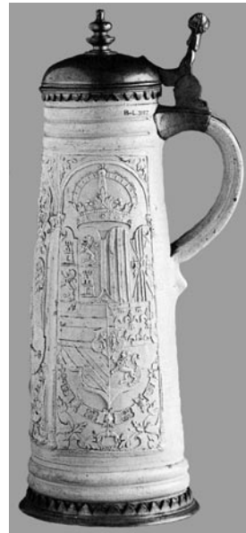
Abb. 4. Schnelle aus dem Jahr 1573 in den Sammlungen von British Museum. Linke Seite (nach: Gaimster 1997, 181, Abb. 20)

Ryc. 3. Kufel kamionkowy z 1573 r. w zbiorach British Museum. Strona prawa. (wg D. Gaimster 1997, s. 181, ryc. 20)