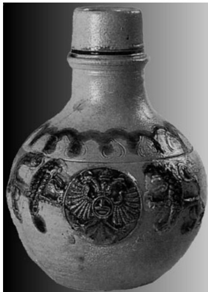
Abb. 8. Steinzeugtopf aus der Mitte des 17. Jhs. in den Sammlungen des Rheinischen Landesmuseums in Trier (nach: Seewaldt 1990, 133)

Es ist unklar, auf welche Weise die Steinzeuggefäße aus dem Rheingebiet nach Nowy Korczyn gelangt sind. Das war eine kleine Stadt, die im königlichen Besitz war und um die Hälfte des 13. Jhs vom König Bolesław Wstydlivy [Bolesław dem Schamhaften] (1226-1279) am linken Ufer der Nida, an deren Mündung in die Weichsel gegründet wurde. Der Aufstieg der Stadt begann in der Regierungszeit des Königs Kazimierz III Wielki [Kasimir des Großen] (1310-1370), der dort eine neue, gemauerte Burg stiftete. Eine besonders wichtige und fast zweihundert Jahre dauernde Rolle in der Geschichte Polens verdankt die am westlichen Rand des damaligen Sandomierz-Landes lokalisierte Stadt Korczyn dem König Władysław Jagiełło [Wladyslaw Jagiello] (1351/1361-1434), der ihr 1409 das Magdeburger Stadtrecht verliehen hat. Die Lage der Stadt begünstigte die Entwicklung des Handels. Ab dem 15. Jh. fand hier regelmäßig der Provinziallandtag des polnischen Adels aus den Krakau-, Sandomierz- und Lublin-Landen, wie auch aus den an die Krone angeschlossenen ruthenischen Gebieten, statt. Die häufigen Aufenthalte der Königsfamilie zogen dorthin auch Wanderer aus fremden Ländern an. In der Zeit der Könige Zygmunt August und Stefan Batory [Sigismund August (1520-1572) und Stephan Bathory (1533-1586)] gab es in Nowy Korczyn eine Waffen- und Schießpulvermanufaktur. Die letzten Ver-