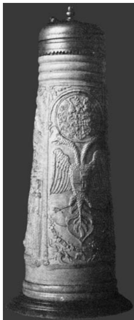
Abb. 5. Schnelle aus dem Jahr 1574, Mittelteil (nach: von Falke 1908, Abb. 123) Ryc. 5. Kufel kamionkowy z 1574 r. Strona centralna (wg O. von Falke 1908, ryc. 123)