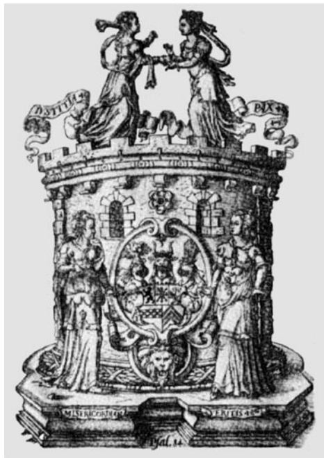
Abb. 6. Holzschnitt mit dem Wappen des Herzogtums Jülich-Kleve-Berg von 1565 (nach: von Falke 1908, Abb. 121) Ryc. 6. Drzeworyt z herbem księstwa Jülich-Kleve-Berg z 1565 roku (wg O. von Falke 1908, ryc. 121)

nowa 1975, 274–276), Witebsk (Lewko 2012, 148–176) und Mir (Zdanowicz, Trusau 1993, 64–65) belegen.