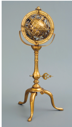
Fot. 7. Globus Jagielloński (ze zbiorów Muzeum UJ) Jagiellonian Globe (Collection of the JU Museum)

ty. Drugiego dnia konferencji (19 sierpnia) dyskutowano kierunki i dynamikę zmian zachodzących w środowisku. Wykład wygłosił prof. Benno Werlen, który zwrócił uwagę na tradycyjne i nowe obszary zmian, które leżą w polu zainteresowań geografów. W trzecim dniu konferencji (20 sierpnia) wykłady wygłoszone przez prof. Zbigniewa Kundzewicza i prof. Gideona Bigera dały okazję do wymiany spostrzeżeń na temat współczesnych wyzwań przed jakimi stoi świat. Mówcy podkreślili rolę przyrodniczych i społecznych aspektów problemów globalnych z ich silnymi lokalnymi reperkusjami. W kolejnym dniu (21 sierpnia) prof. Julie Winkler i prof. Andreas Faludi podjęli próbę określenia zakresu odpowiedzialności ludzkości za zmiany jakie zachodzą w megasystemie środowiska geograficznego. Bardzo ciekawa była dyskusja pomiędzy wszystkimi panelistami, jaka miała miejsce w ostatnim dniu konferencji (22 sierpnia). Jej moderatorem był prof. Andreas Faludi, który bardzo syntetycznie podsumował dyskusję i wskazał najważniejsze problemy badawcze dla współczesnej geografii.