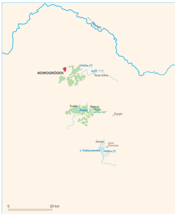
2. Mapa „nowogrodzkiej strony”

(© Wydawnictwo Kartograficzne Polkart Michał Siwicki)