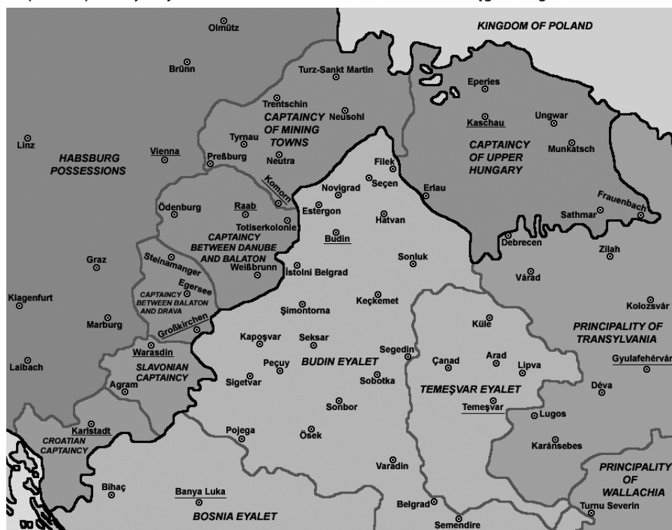
Central Europe in 1572: