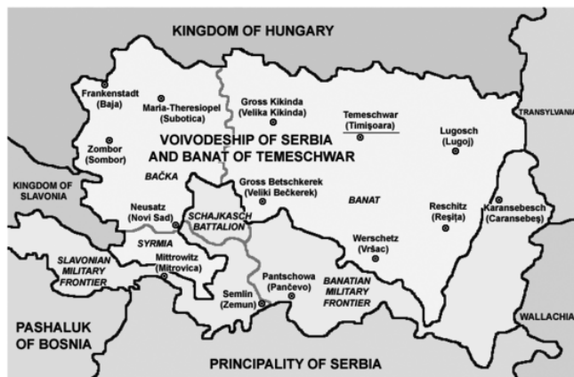
Mapa 1. Prowincja Vojvodina i Banat 1848-1860

Wschodni Śrem został przyłączony do już istniejącego węgierskiego komitatu Szerém ze stolicą w Vukovarze.