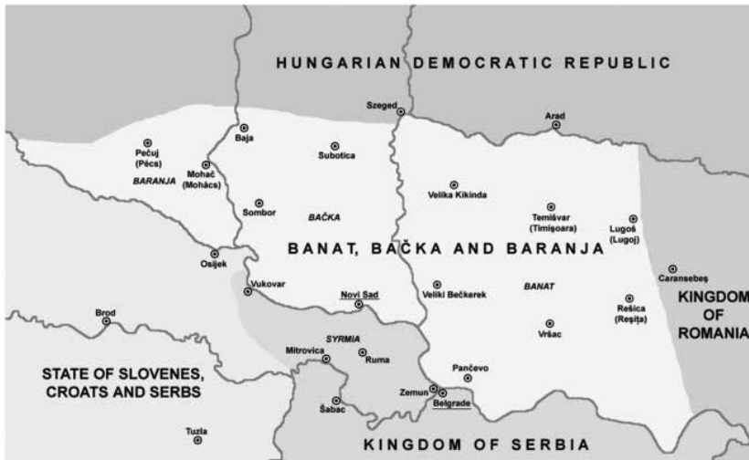
Mapa 3. Barania, Baczka i Banat zajęte przez wojsko Królestwa Serbii 25 listopada 1918 r.

Political situation in November 25, 1918: