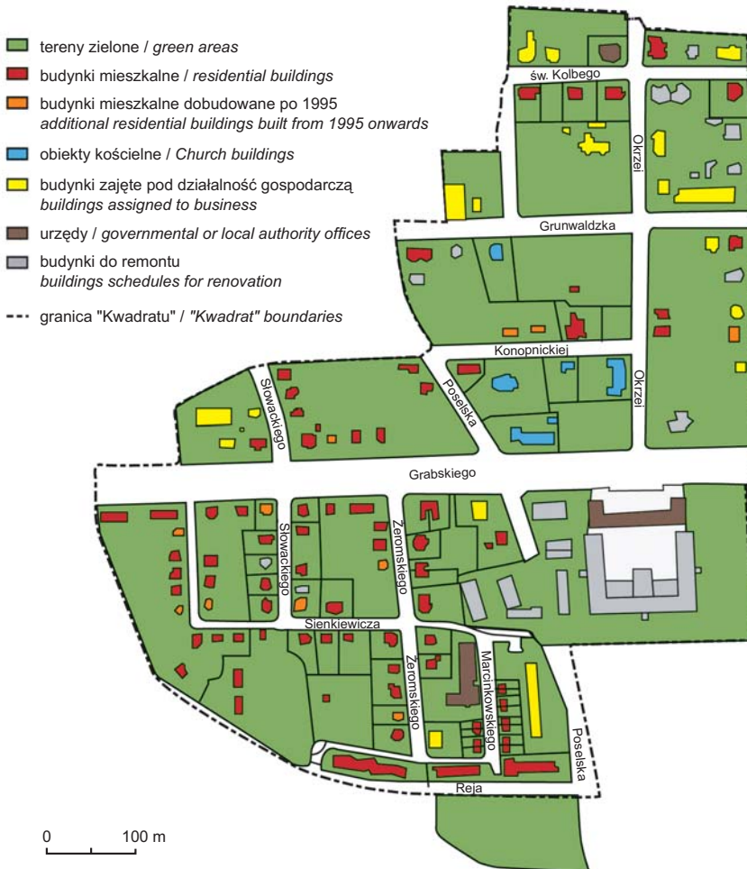
Ryc. 2. Zagospodarowanie „Kwadratu” w Legnicy w 2002 r.

Pozostałe wille zostały zagospodarowane przez: Wojewódzki Fundusz Ochrony Środowiska i Gospodarki Wodnej, Wyższe Seminarium Duchowne Diecezji