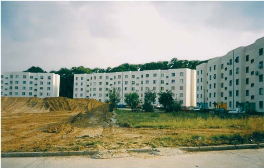
Fot. 1. Bloki „Leningrady” przy ul. Reja The blocks of flats known as “Leningrads” at Reja St. (Fot./Photo: S. Sobotka).