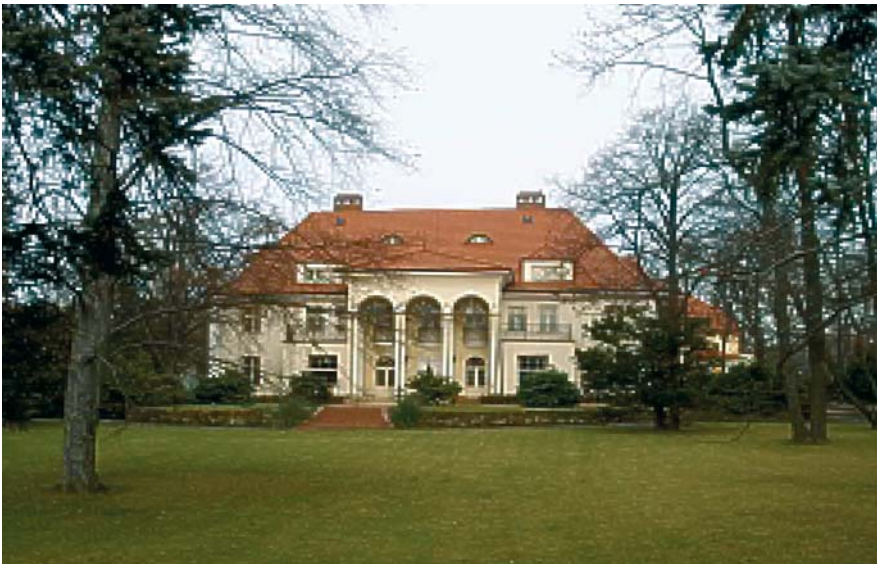
Fot. 2. Hotel i restauracja „Rezydencja” The Rezydencja Hotel and Restaurant