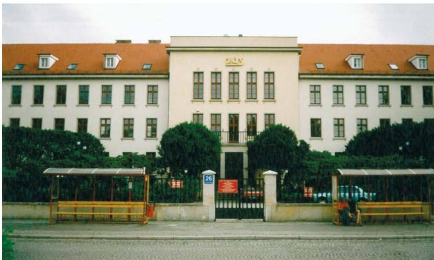
Fot. 3. Siedziba ZUS przy ul. Grabskiego

Na zakończenie przeglądu form zagospodarowania budynków w Legnicy, warto wspomnieć o największym obiekcie na terenie „Kwadratu” – siedzibie Centralnego Sztabu Północnej Grupy Wojsk Radzieckich przy ulicy Grabskiego. To właśnie z tego miejsca miano realizować plany wojenne na całym froncie zachodnim, od Łaby do Oceanu Atlantyckiego. Liczy on ponad 700 pomieszczeń, zaś jego powierzchnia wynosi 25 000 m 2 . Łącznie obejmuje 5 kondygnacji, w tym 2 pod ziemią (Walentek, 1995). Obecnie frontową część zajmuje Zakład Ubezpieczeń Społecznych (fot. 3), a położony w głębi budynek w kształcie litery U pozostaje niezagospodarowany. Został on dobudowany przez Rosjan, zaś frontowa, zagospodarowana część, to przedwojenna siedziba Wehrmachtu.