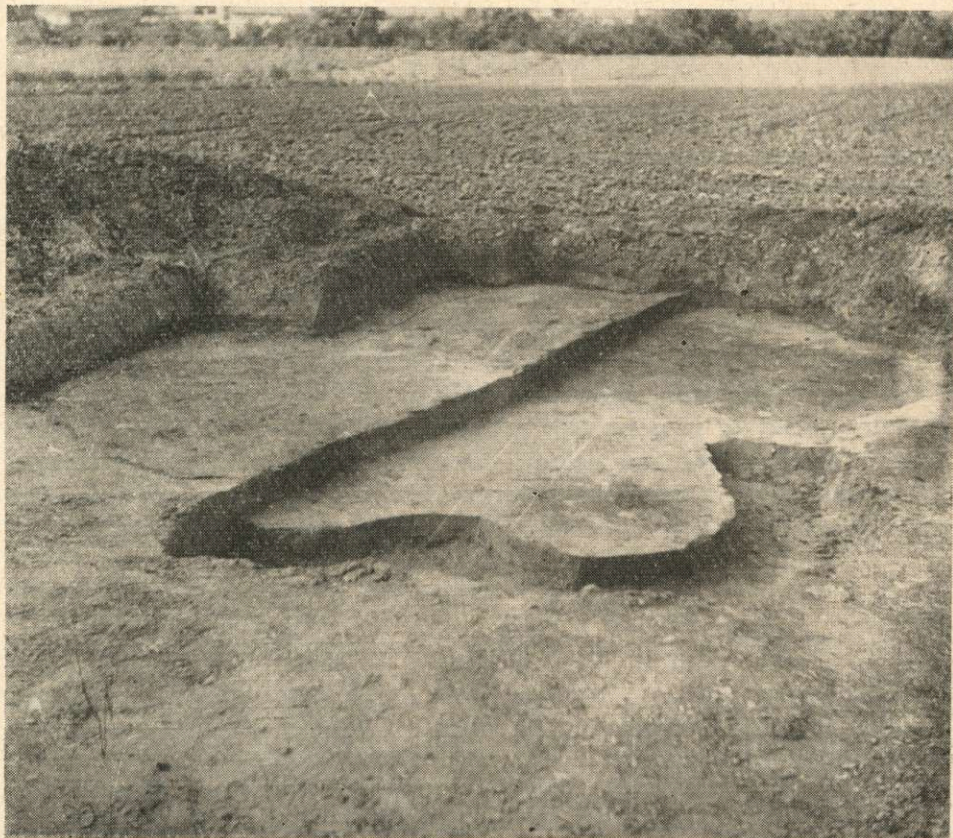
Ryc. 1. Janówek, pow. Dzierżoniów. Obiekt nr 111 w czasie eksploracji

W czasie kampanii wykopaliskowej w 1966 r. na stanowisku osadniczym w Janówku, pow. Dzierżoniów, odkryto obok obiektów południowej grupy kultury pucharów lejowatych i kultury unietyckiej dwa obiekty (jamy nr 109 i 111), których materiały bezspornie wiązać należy z kulturą lendzielską (ryc. 1) 6 . Zarówno jednak formy ceramiczne, jak i kano-