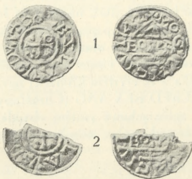
I. Denár Boleslavův s opisem MOGIVN CIVITAS.