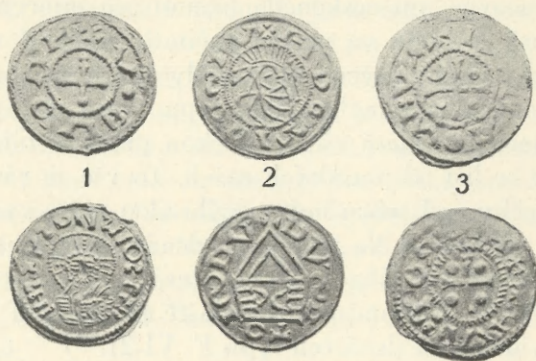
II. Nové typy Jaromírových denárů z nálezu na vrchu Řivnáči.

Že Jaromírovy denáry byzantského rázu nevznikly někde v cizině, 119) nýbrž v českých mincovnách, dokazuje jednak denár z ruského nálezu Ladeinoie Pole, 120) který má v rubu kolem Kristova poprsí opis PRAGA CIVITAS. Také denár F. 465 (F. VI-22) má v rubu kolem Kristovy hlavy v opisu stopu jména pražské mincovny. Nový typ denáru F. VI-23, který se našel v nálezu na vrchu Řivnáči, má opis + V. ΘΥΟΑΝ, nese tedy jméno pražského mincmistra či nájemce mince Nacuba (viz obrázek v textu č. II-1). Není tím ovšem zase řečeno, že všechny Jaromírovy denáry byzantského rázu vznikly v Praze. Spojení s Jaromíro-