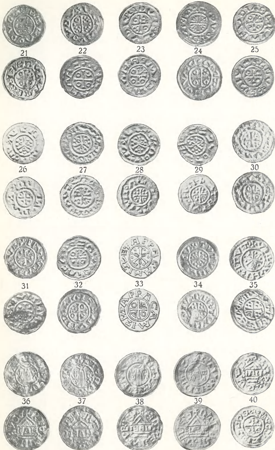
Boleslav III. (?) č. 21; Vladivoj č. 22—26; Boleslav III. (po druhé) č. 27—50; Boleslav Chrabrý č. 51—59. — Boleslav III. (Vyšehrad) č. 40.