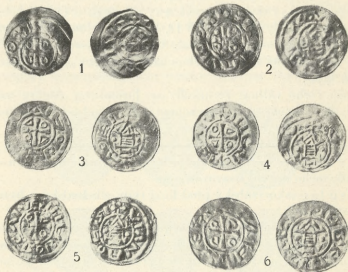
III. Mince oto-adelheidského rázu přisuzované mylně Vladivojovi (č. 1, 2) a Jaromírovi (č. 3—6).