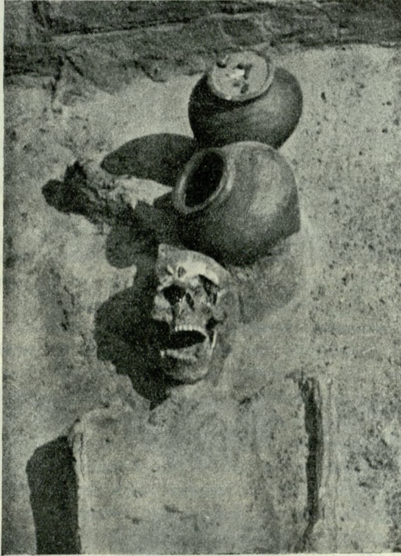
Abb. 1. Skelettgrab der Spätlatènezeit. (Godawy, Kr. Żnin).

parkes, beim Bau der Inhalationshalle gefunden. Weiter gegen Norden, in Pommerellen, hatte man schon im Jahre 1888 ein ähnliches Grab in Rządź, Kreis Grudziądz (Grab 566) entdeckt, da es jedoch damals an Analogien gänzlich gebrach, hat der