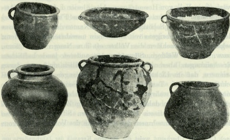
Abb. 3. Keramik aus Skelettgrab Nr. V der Spätlatènezeit. (Biskupin, Kr. Žnin).