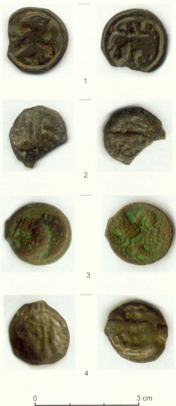
Pl. 3. Les monnaies celtiques: 1 — série 191, 2 — série 186, 3 — série 147, 4 — série 186.