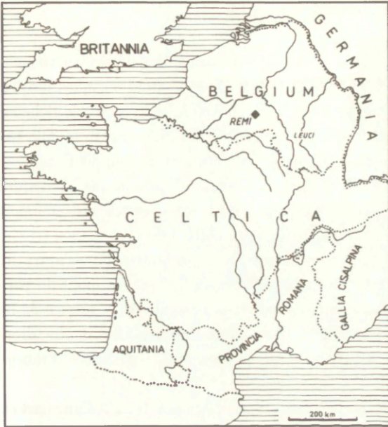
◆ — LA FRANCE A L'ANTIQUITÉ CELTIQUE GALIA NIEPODLEGLA

Pl. 2. La France a l'Antiquité Celtique; (d'après Benoît 1969) a — Neufchâtel-sur-Aisne