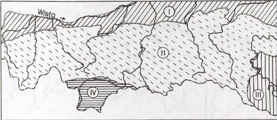
Ryc. 1. Podział fizycznogeograficzny obszaru prawobrzeża górnej Wisły (wg Kondracki 1994); I — Północne Podkarpacie, II — Zewnętrzne Karpaty Zachodnie, III — Zewnętrzne Karpaty Wschodnie, IV — Centralne Karpaty Zachodnie

Fig. 1. Physical-geographic division of the area on the right bank of the upper Vistula River (after Kondracki 1994); I — Northern Carpathian Foothills, II — Outer Western Carpathians, III — Outer Eastern Carpathians, IV — Central Western Carpathians